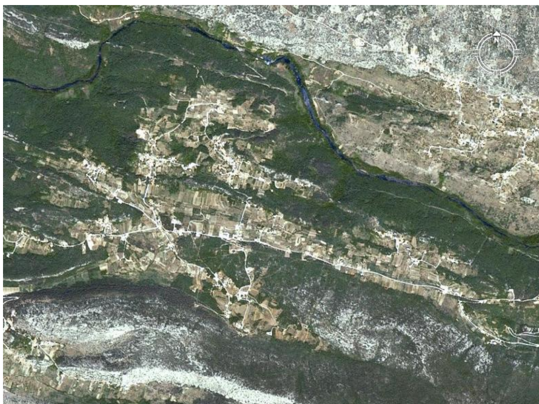
Slika 1. Satelitska snimka sela Kučiče

U ovom završnom radu govorit će se o usmenim narodnim bajkama sela Kučiče. Selo Kučiče malo je mjesto u Dalmatinskoj zagori koje se nalazi na visoravni uz rijeku Cetinu. Prvi se put spominje 1315. godine u darovnici kneza Jurja Šubića. Kučiče je od grada Omiša udaljeno svega petnaestak kilometara te po zadnjem popisu stanovništva broji nešto više od šesto stanovnika. Iako naizgled malo selo, veoma je tradicijski orijentirano te je bogato kulturno-povijesnom materijalnom i nematerijalnom baštinom.