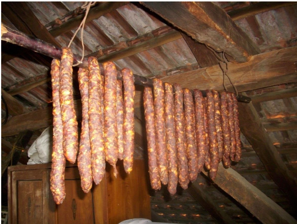
Slika 1. Tradicionalne fermentirane kobasice iz domaćinstva

Proizvodnja domaćih trajnih kobasica u našoj zemlji ima jako dugu tradiciju (ŽIVKOVIĆ, 1986.). Tijekom procesa zrenja se odvijaju jako složeni mikrobiološki, biokemijski ali i fizikalno-kemijski procesi koji utječu na sigurnost i na kakvoću proizvoda (HADŽIOSMANOVIĆ i sur., 2005.). Stupanj početne mikrobne kontaminacije će ovisiti o mikrobiološkoj kakvoći sirovine i dodataka kao i o (ne)higijenskom pristupu prilikom proizvodnje (ZDOLEC, 2007.). Tipične fermentirane kobasice su karakteristične za određena područja (npr. slika 1, Prigorje) kako po svojoj tehnologiji proizvodnje i karakterističnim senzornim svojstvima tako i po dominaciji određene vrste mikroorganizama u nadjevu.