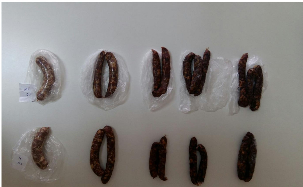
Slika 2. Kontrolne i eksperimentalne kobasice prema danima zrenja (s lijeva na desno od 0., 7., 14., 30. i 40. dan).

Na slikama 2-4 prikazane su kobasice iz istraživanja, prema fazama zrenja (0.-40. dan), te presjek kobasica (40. dan)