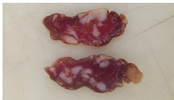
Slika 3 i 4. Presjek kobasica na kraju zrenja.