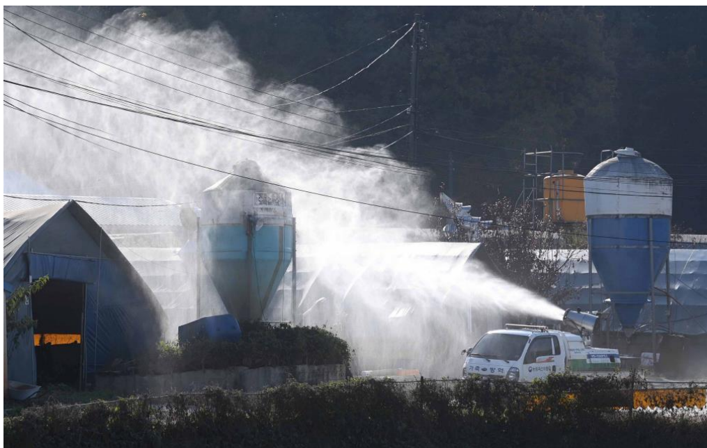
Slika 8. Potpuna dezinfekcija peradarskih objekata.