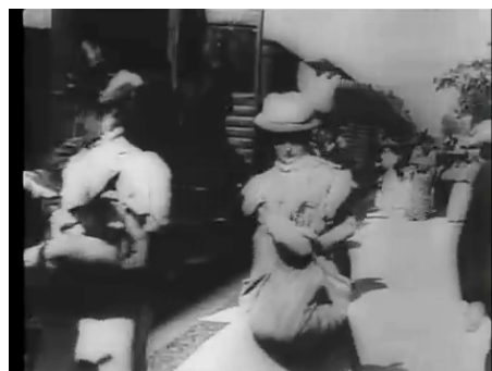
3. Dolazak vlaka u La Ciotat (1895)