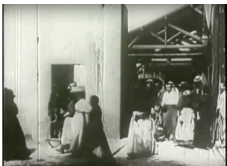
2. Izlazak radnika iz tvornice (1895)

Braća Lumière ( zahvaljujući kinematografu ) su napravili identičan čin što ga je primjerice u novijoj povijesti napravio Steve Jobs s prvim pametnim telefonom, mada nije izmislio internet, stvorio je industriju koja sve više i više konzumira isti.