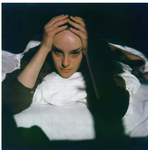
Slika 4. Furuya, Seiichi, Graz 1979. , iz serije Portrait 1979. , 20

Seiichi Furuya je japansko-europski fotograf rođen u Japanu 1950. godine. Nakon završenog fakulteta preselio se u Austriju, gdje u Grazu osniva fotografski časopis Camera Austria . U Grazu 1978. godine upoznaje svoju buduću ženu Christine, koja je glavna inspiracija i tema njegovih fotografskih radova. Furuya i Christine proveli su zajedno osam godina, sve do 1985. godine kada je počinila samoubojstvo. Nakon njezine smrti, Furuya je počeo pregledavati svoj fotografsku arhivu te stvarati fotografske knjige pod imenom Memoires . Do 2020. godine Furuya je objavio šest fotografskih knjiga – memoara – koji se sastoje većinom od portreta Christine (slika 4.).