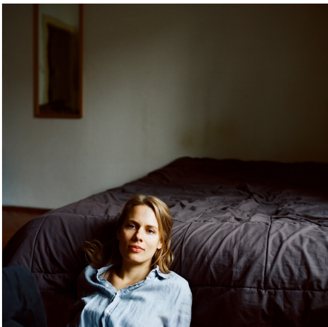
Slika 7. Pukanić, Sara, Portret Lune , iz serije (Auto)portret ljubavi , 2023.

Furuya je često fotografirao i u boji, no njegove crno-bijele fotografije posebno ističu Christino lice i figuru. Na portretu iz 1979. godine (slika 8.), pozadina je u sjeni, tamna i pročišćena, a u prvi plan smješta se sama Christine. Fotografije pokazuju kako Furuya pomoću svjetla i sjene prikazuje različita unutarnja stanja Christine odražena na njezinom licu, a u Furuyinim fotografijama posebno se ističe Christina egzistencijalna osamljenost.