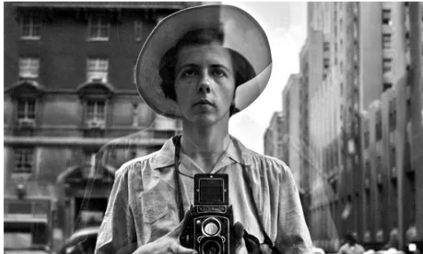
Slika 29. Maier, Vivian, Self-portrait , nepoznata godina

New Yorka (slika 29.) . Fotografija odraza u staklu je nejasna i замуćena, kao odraz na površini vode, pa pojačava dojam nestabilnosti, kratkotrajnosti i krhkosti uhvaćenog prikaza. Maier često snima u hodu, za vrijeme šetnje gradom pa se radi o fotografijama snimljenima iz ruke što često utječe na oštrinu fotografije.