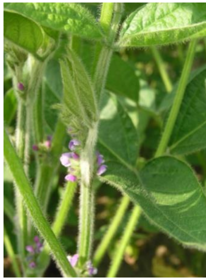
Slika 8. Sorta soje AFZG Ana

Sorta soje AFZG Ana (slika 8) ima čvrstu stabljiku, dobru otpornost na plamenjaču te je otporna na polijeganje. Ovu sortu ubrajamo u vegetacijsku skupinu 0. Sadrži 35-40% bjelančevina te 19-23% ulja. Značajnije fenotipske karakteristike su da ima izdužene liske, sivu boju dlačica, okruglo sjeme sivog hiluma te ljubičastu boju cvijeta. Potencijal rodnosti iznosi 5 t/ha dok je preporučeni sklop 580 000-650 000 biljaka po hektaru.