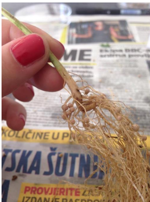
Slika 4. Korijen soje s kvržicama

Kvržice se počinju stvarati na korijenu soje od trenutka infekcije korijena bakterijama B. japonicum kroz korjenove dlačice. Nakon četiri tjedna od infekcije promjer kvržica je najveći i fiksiranje dušika je intenzivno. Na aktivnost sojinih bakterija utječu fizikalna i kemijska svojstva tla, posebno pH tla jer se bakterije slabo razvijaju u kiselim tlima, zatim klimatski čimbenici u vidu temperature i oborina, prozračnost tla, agrotehnika i gnojidba tla.