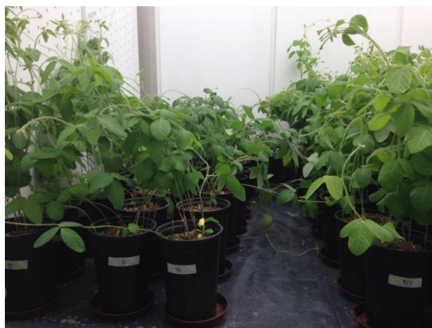
Slika 7. Vegetacijski pokus u komori rasta s inokuliranom sojom u fazi pune cvatnje (27.03.2017.)

Svi rezultati vegetacijskog pokusa statistički su obrađeni analizom varijance (ANOVA) prema modelu slučajnog bloknoeg rasporeda dvofaktorijalnog pokusa (sorta x soj).