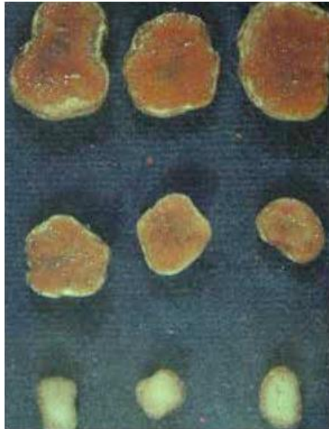
Slika 1. Učinkovite (prvi red odozgo), manje učinkovite i neučinkovite kvržice