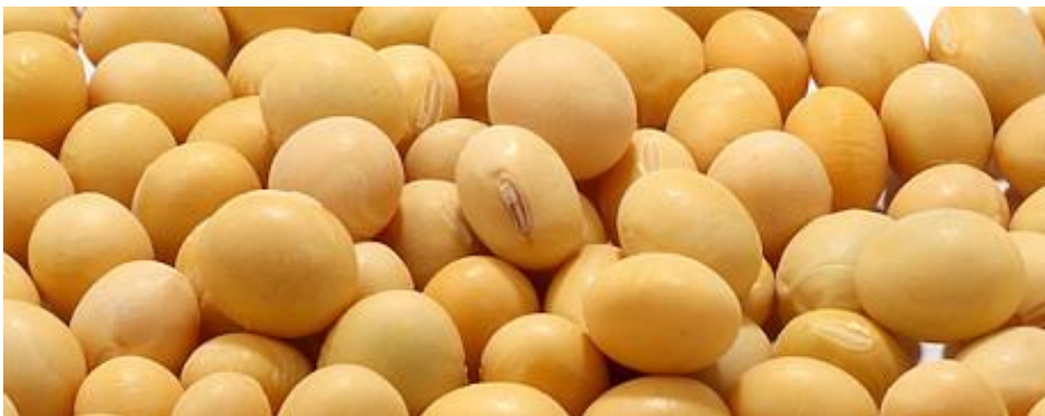
Slika 3. Sjeme soje

Značaj i važnost soje proizlaze iz kakvoće njezinog sjemena koje sadrži 35-50% bjelančevina te 18-24% ulja, ovisno o sorti i uvjetima uzgoja (Slika 3).