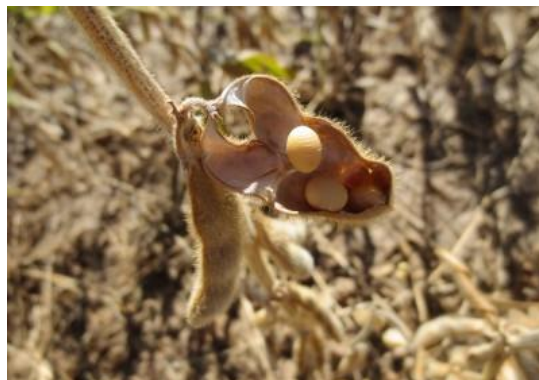
Slika 5. Soja pod utjecajem suše

Prema Vratrić i Sudarić (2008.) jedan od osnovnih činitelja koji limitira biljnu proizvodnju je voda. Za vrijeme rasta služi za prenošenje hranjivih elemenata i proizvoda izmjene tvari iz pojedinih tkiva i organa u druga tkiva i organe te također omogućuje izmjenu raznih enzimskih procesa. Voda ima jako veliki utjecaj na rast i razvoj soje pa je prema tome stres izazvan sušom najozbiljniji limitirajući faktor u njezinoj proizvodnji (Popović i sur. 2015.). Deficit vode i ishrane te visoke temperature izazivaju abiotički stres kod soje. Jako je osjetljiva na nedostatak vode pogotovo u fazi cvjetanja i formiranja mahuna. U takvom sušnom periodu razvoja prinos soje se može smanjiti za 32 do 42%. U sušnim uvjetima soja odbacuje cvjetove i dolazi do velikog smanjenja oplodnje, a samim time i do značajno nižih prinosa. Kako navodi Popović (2010.) biljke soje koje su izložene suši (Slika 5) i visokim temperaturama proizvode manje mahuna, manji broj sjemena u mahuni, nižu masu sjemena te je krajnji rezultat laboratorijska i poljska klijavost sjemena. .