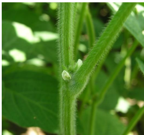
Slika 9. Sorta soje Gabriela