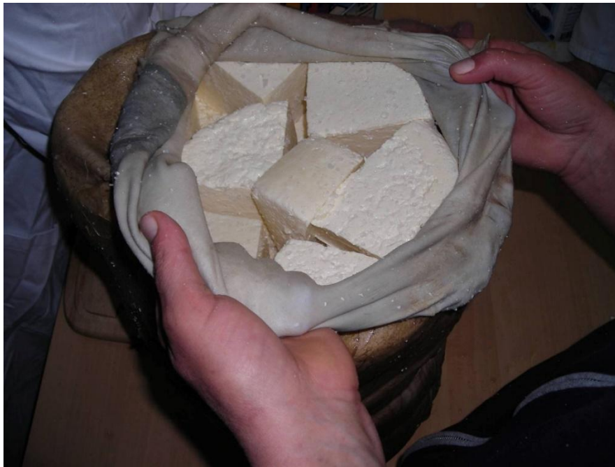
Slika 5.2.1.1. Punjenje sira u mišinu

zreli sir iz mišine pripada skupini tvrdih sireva. Mlijeko korišteno u proizvodnji sira iz mišine bogatog je kemijskog sastava s velikim udjelom suhe tvari i masti, pa stoga sir iz mišine pripada skupini masnih sireva s prosječnim udjelom masti u suhoj tvari sira 55,52% na kraju zrenja (Kaić i sur. 2008.). Sir je nakon završenog procesa zrenja čvrste konzistencije, bijele do žućkaste boje (Slika 5.2.1.2.). Boja sira najviše ovisi o vrsti mlijeka i dužini zrenja u mišini.