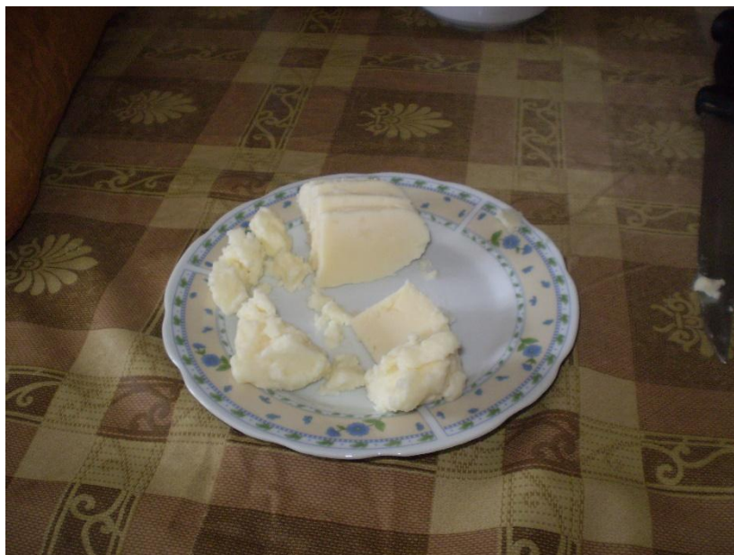
Slika 5.2.1.2. Zreli sir iz mišine za konzumaciju