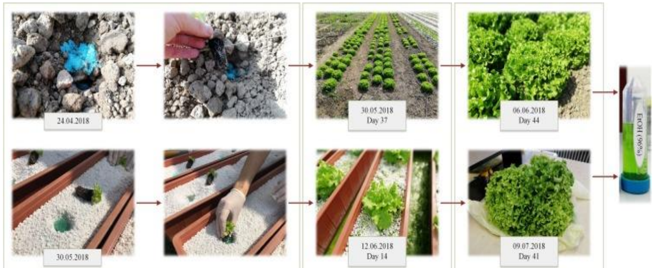
Slika 3.2.1. Prikaz aplikacije mikrokapsula i dozrijevanje salata u dva načina uzgoja (konvecionalni i hidroponski)

30 cm, te se koristilo 4 uzgojne posude po tretiranju. Položene su u hranjivu otopinu bogatu nutrijentima u omjeru koji je preporučan za lisnato povrće (Pimpini i sur., 2005). Tijekom razdoblja vegetacije, svakog dana svaki pratili su se svi bitni parametri; temperatura, pH vrijednost, elektrokonduktivnost kao i minimalna i maksimalna temperatura te vlažnost zraka. Berba je obavljena 09. srpnja te su se mjerile masa rozete, visina i promjer rozete te prinos po kvadratnom metru.