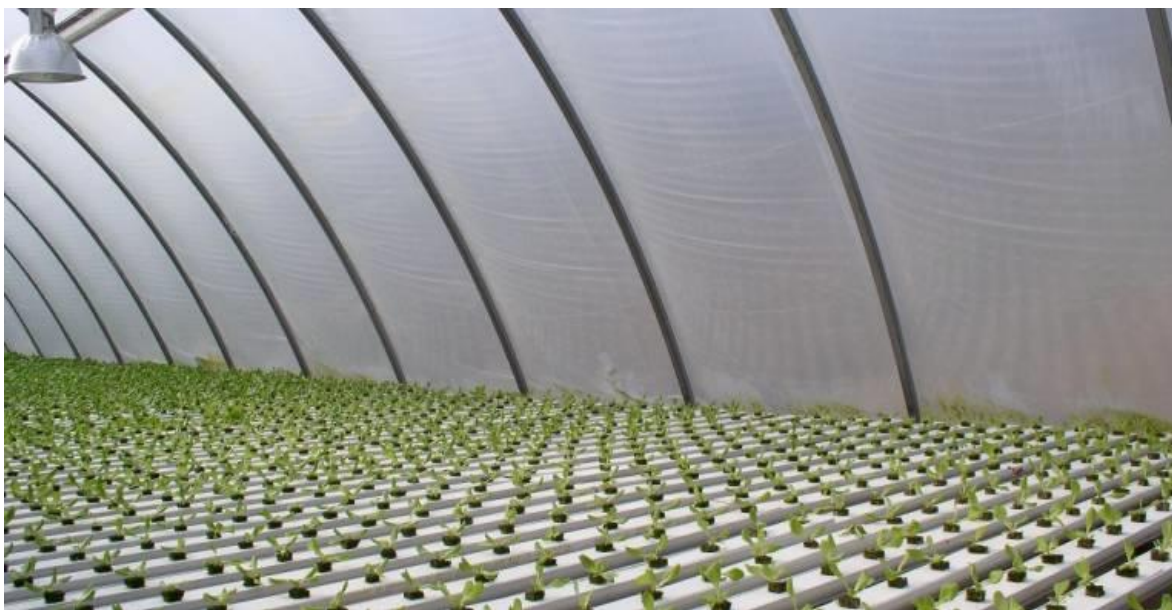
Slika 2.4.1. Hidroponski uzgoj salate u zaštićenom prostoru