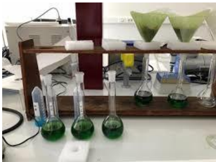
Slika 3.4.1. Prikaz kemijske analize uzoraka (Haramija, 2019)