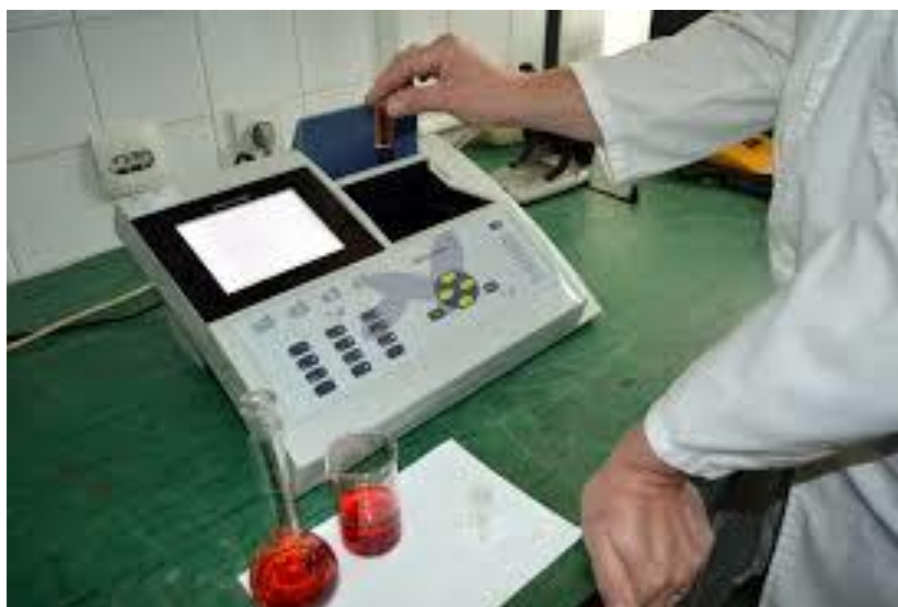
Slika 3.4.1. Spektrofotometar

Udjel ukupnih klorofila određuje se ekstrakcijom 1000 g pigmenta sa 25 mL 80%-tnog acetona. Spektrofotometrijski se pri 663 i 645 nm mjeri intezitet nastalog obojenja, a kvantifikacija se vrši prema jednadžbama od Huang i sur. (2007). Od homogenizirane tvari odvaže se 0,1 g te doda 25 mL 80%-tnog acetona. Otopina se vorteksira 2 minute, a dobiveni ekstrakt se filtrira kroz Whatman broj 4 filter papir i nadopuni s otapalom do oznake. Priprema ekstrakata i sva mjerenja provode se tri puta, a rezultati su izraženi kao srednja vrijednost \mu\text{g}\cdot\text{g}^{-1} suhe tvari (Haramija, 2019).