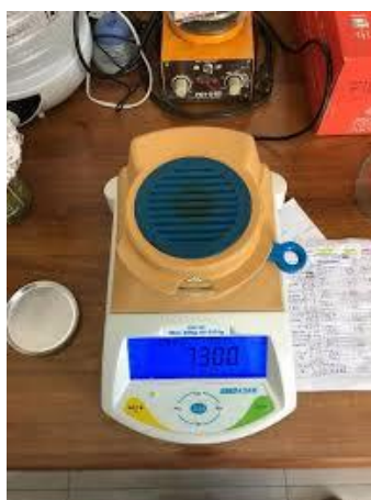
Slika 3.4.1. Halogeni vlagomjer za mjerenje udjela suhe tvari (Haramija, 2019)

Suha tvar se mjeri u posebnom uređaju - halogenom vlagomjeru (Slika 3.4.2). Listovi salate odabrani iz pojedine uzgojne posude oprani su prvo vodom iz slavine, zatim destiliranom vodom te osušeni uz pomoć papirnatih ručnika. Usitnjeni su mikserom i po 5 g dobivene smjere stavljeno je na sušenje u halogeni vlagomjer do konstantne mase. Dobiveni rezultati analiza izraženi su u postotcima (Haramija, 2019).