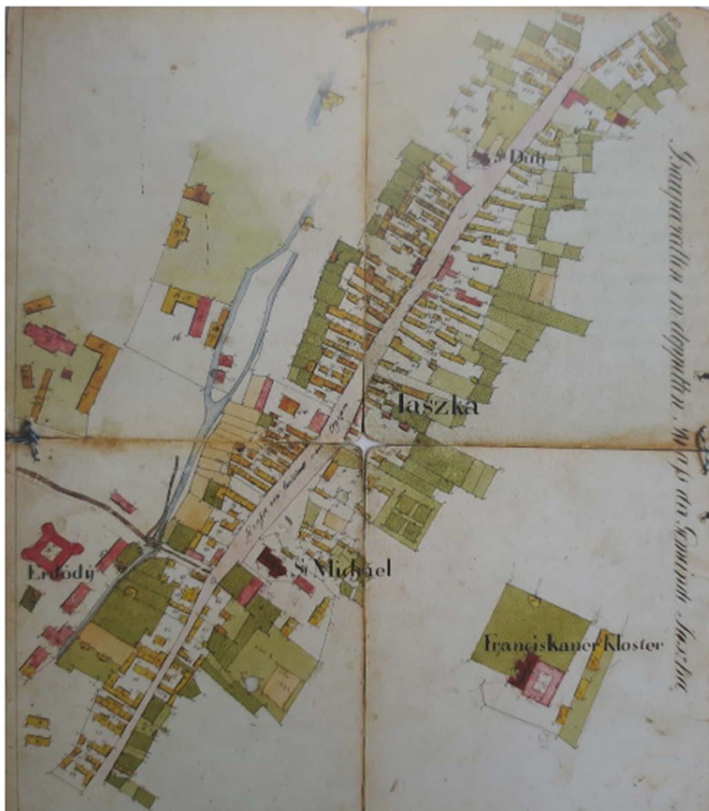
Slika 1. Prikaz lokacije parka i dvorca Erdödy, karta iz 1760. godine, Gradski muzej i galerija Jastrebarsko

Najstariji kartografski prikaz obuhvata budućeg perivoja s dvorcem je na Jozefinskoj karti iz 18. stoljeća, no na njemu tada još nema prikaza uređajne osnove perivoja (slika 1).