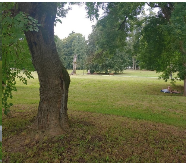
Slika 10. Odmor i šetnja posjetitelja perivojem, veliko stablo crnog dudu ( Morus nigra L.) s mnogo zrelih plodova na podu

Figure 9. View from the bridge towards Žitnica and the castle