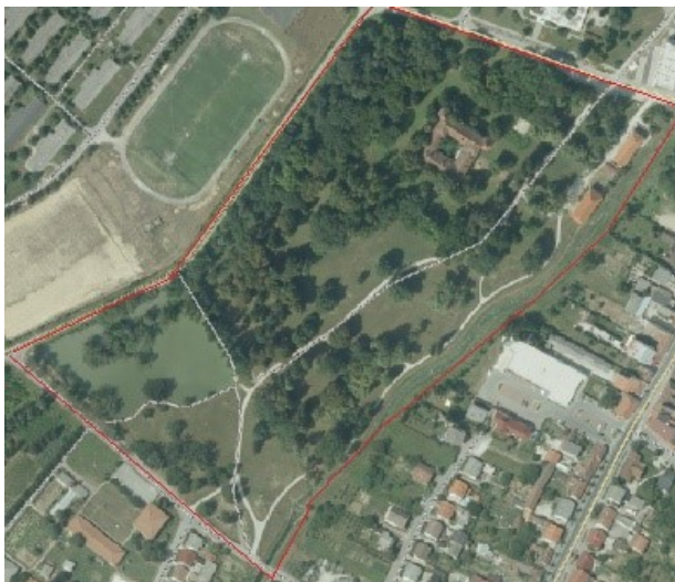
Slika 3. Prikaz granice obuhvata parka Erdödy u Jastrebarskom

Figure 3. View of the boundaries of Erdödy Park in Jastrebarsko