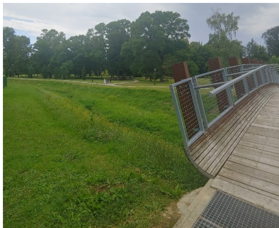
Slika 8. Pogled na južni dio perivoja prema jezeru

Figure 7. Renovated Žitnica (Granary) in the park of Erdödy Castle with infrastructure for a public event, June 2022