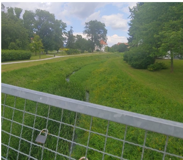
Slika 9. Pogled s mosta prema Žitnici i dvorcu

Figure 8. View of the southern part of the park towards the lake