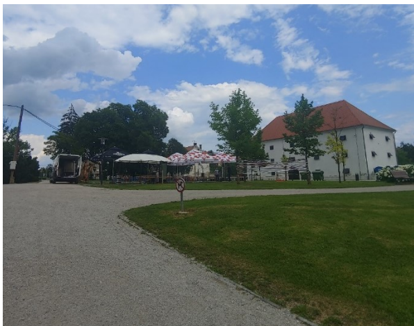
Slika 7. Obnovljena Žitnica u perivoju dvorca Erdödy sa infrastrukturom za javnu manifestaciju, lipanj 2022. (Foto: I. Vitasović-Kosić, 2022)

Figure 7. Renovated Žitnica (Granary) in the park of Erdödy Castle with infrastructure for a public event, June 2022 (Photo: I. Vitasović-Kosić, 2022)