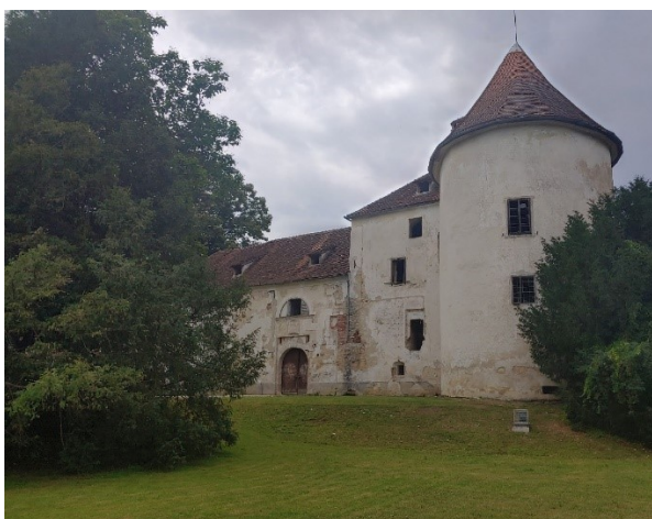
Slika 5. Prikaz ugaone kule dvorca Erdödy u Jastrebarskom

Figure 4. The renovated building of the Žitnica (Granary), today it is a space for public manifestations and gatherings