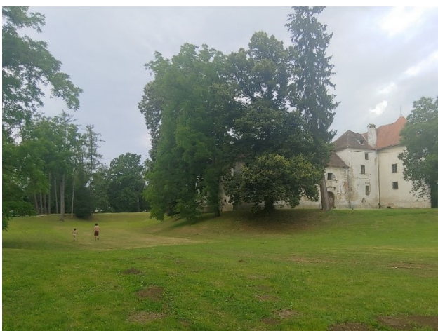
Slika 6. Pogled na veliku travnatu površinu okruženu grupama stablašica istočno od dvorca Erdödy u Jastrebarskom

Figure 5. View of the corner tower of Erdödy Castle in Jastrebarsko