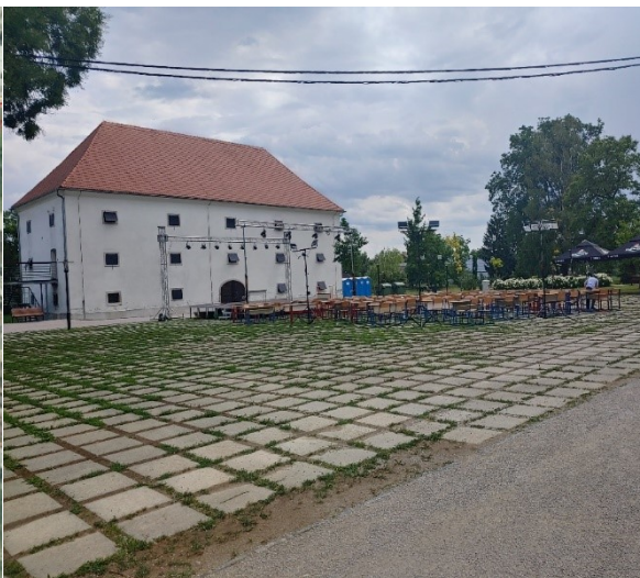
Slika 4. Obnovljena zgrada Žitnica, danas je prostor za javne manifestacije i okupljanja

Figure 3. View of the boundaries of Erdödy Park in Jastrebarsko