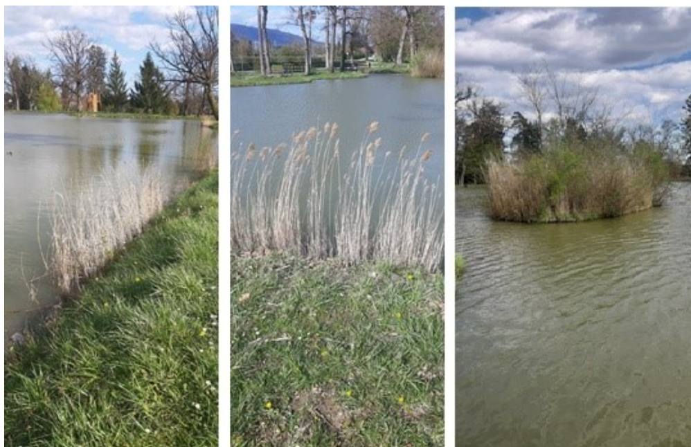
Slika 12 a.b.c. Phragmites australis (Cav.) Steud. (obična trska) rasprostranjena je na otvorenom staništu, u jezeru, u plitkoj vodi. Vizura se otvara na jezero i park u daljini.

Prema Bužan et al. (2009) svo samoniklo drveće, grmlje i korov potrebno je ukloniti prema detaljnoj valorizaciji zelenila; na cijeloj zapadnoj strani perivoja tj. na površini između odvodnog kanala i ceste za Črnilovec izvesti cjeloviti zahvat njege i čišćenja od samoniklog drveća, grmlja i korova. Prema planu valorizacije biljnih vrsta, skupine stabala i solitere koje čine osnovu perivojne kompozicijske strukture potrebno je očistiti od samoniklog podrasta i novo posađenih stabala. Međutim, u okviru vodenog staništa jezera i potoka (slika 12 a, b, c), postojeća močvarna vegetacija doprinosi prirodnom dojmu ambijenta perivoja, te se ovim radom ističe da je u tim situacijama istu potrebno zadržati.