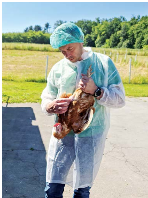
Slika 2. Način provedbe palpacije prsne kosti kokoši nesilica. Figure 2. Method of palpation of the laying hen sternum.