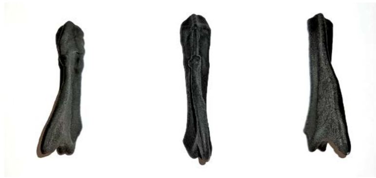
Slika 1. 3-D modeli prsni kostiju kokoši s devijacijama i lomovima. Figure 1. 3-D models of hen sternum with deviations and fractures.