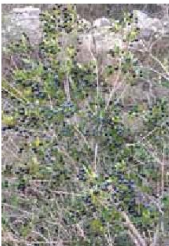
Slika 1. Grm mirte u prirodi / Picture 1. Myrtle shrub in nature

U tablici 1 prikazan je osnovni kemijski sastav plodova mirte. Plodovi mirte sadržavaju eterična ulja koja su razlog njihovog jakog aromatičnog mirisa (Usai i sur., 2018). U nezrelim plodovima prevladava gorki i adstringentni okus koji se javlja zbog sadržaja tanina, a dozrijevanjem plodovi postaju tamniji slatkasti i gorčina se gubi (Slika 2). Zbog dobrih antioksidativnih svojstava, Tuberoso i sur. (2010), preporučuju korištenje ekstrakta plodova u prehrambene i medicinske svrhe. U narodnoj medicini mirta se koristi za liječenje raznih bolesti, kao što su bolesti probavnog trakta te urinarnih i kožnih oboljenja. Plodovi djeluju protuupalno, antitumorno te imaju antitrombotično djelovanje (Giamipieri i sur., 2020). Plodovi sadrže oko 1,41-1,28% ukupnih šećera, 0,006-0,33% ukupnih kiselina, sadržaj proteina se kreće od 4,17 do 9,02%, dok sadržaj ugljikohidrata i celuloze čini oko 79,78% (Fadda i Mulas, 2010; Şan i sur., 2015; Haciseferoğulları i sur., 2012; Aydin i Özcan, 2007; Corredu i sur., 2019). Od organskih kiselina, u plodovima su u najvećoj mjeri zastupljene limunska, askorbinska, vinska, taninska te jabučna kiselina. Značajan sadržaj ima limunska kiselina koja u plodovima iznosi oko 120,00-1104,85 mg/100g (Giampieri i sur., 2020; Haciseferoğulları i sur., 2012; Fada i sur., 2016). U najvećem udjelu u plodovima nalazimo fenolne spojeve, flavanoide i antocijane (Sumbul i sur., 2011), koji su esencijalni kako za biljku tako i za ljudsko zdravlje.