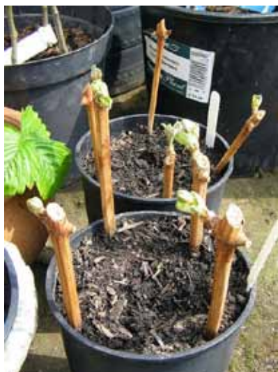
Slika 1. Postupak ukorjenjivanja reznica vinove loze

Vinova loza se može vegetativno razmnožavati na više načina: grebenicama ili povaljenicama trsa, reznicama ili ključicama i cijepljenjem ili navrtanjem. Ovdje ćemo obraditi klasični način cijepljenja omega spojem u rasadniku.