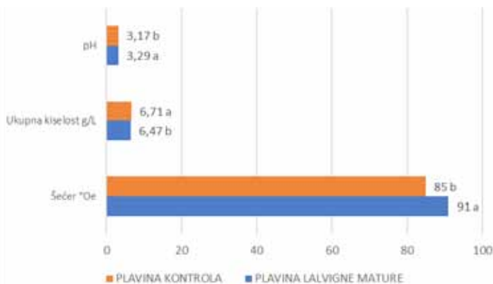
Grafikon 1. Osnovna kemijska analiza mošta sorte Plavina Graph 1. Basic chemical analysis of Plavina must

Na grafikonu 1. prikazane su vrijednosti prosječnog sadržaja šećera, ukupne kiselosti te pH vrijednosti. Vidljivo je da tretman Lalvigene mature signifikantno utječe na nakupljanje višeg sadržaja šećera u grožđu, te na nešto nižu ukupnu kiselost, što je rezultiralo i višom pH vrijednošću. Razlike u ukupnoj kiselosti između tretmana prvenstveno je vezana uz nešto višu koncentraciju jabučne kiseline u kontrolnom tretmanu što je vidljivo na grafikonu 2. U koncentracijama ostalih organskih kiselina razlike između tretmana nisu bile značajne.