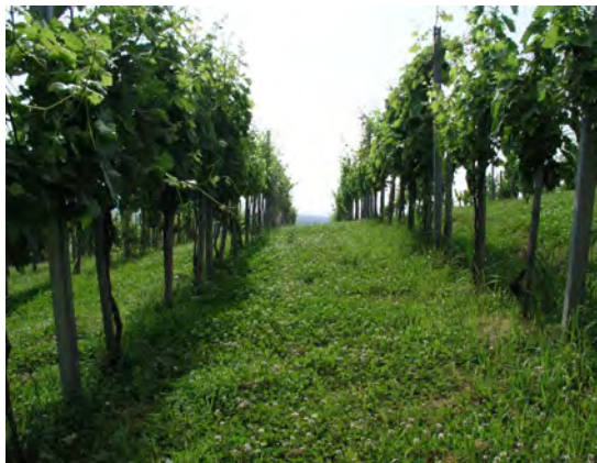
Slika 4. Primjer zatravljivanja ukupne površine spontanom florom i primjer cvatnje djeteline (privlači pčele) neposredno nakon košnje

Treba spomenuti da brojni autori preporučuju smjesi dodati određene leguminoze (bijelu djetelinu, zvjezdan), što sigurno ima velike prednosti (osobito s gledišta dužine trajanja zelenog pokrova, vezanja atmosferskog dušika i sl.), a s ekološkog se gledišta općenito procjenjuje da ih nije dobro dodavati u smjesu trava. Naime, bez obzira na čestu košnju, pojedine cvjetne glavice djetelina i zvjezdana izmaknu zahvatu noža kose ili malčera (slika 4).