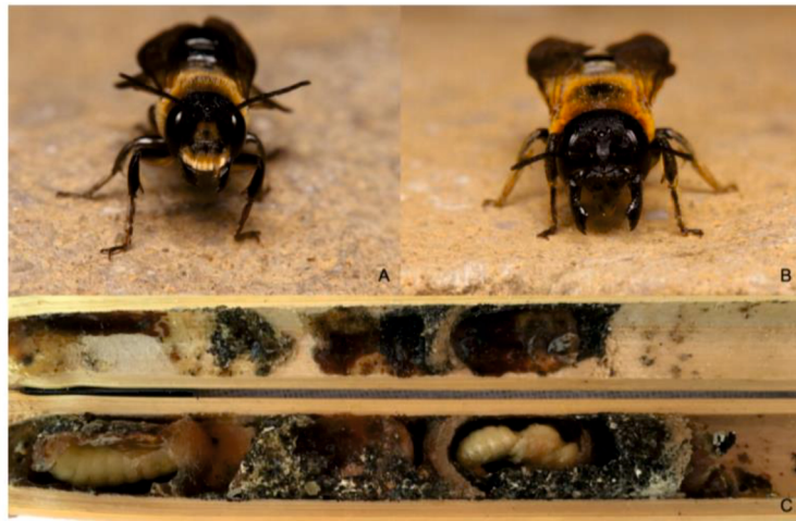
Slika 2. Spolni dimorfizam. A) mužjak, B) ženka, C) ličinke

često uočene kako se hrane na cvijeću japanskog bagrema ( Styphnolobium japonicum ) (Lanner i sur., 2020.; Lanner i Bila Dubaić, 2021.; Centar za biologiju pčela, 2021.).