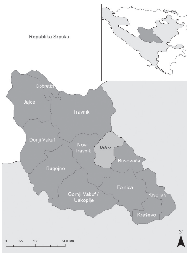
Slika 2. Prikaz općine Vitez (izradila Gugić K. – Arc Map)

Biljke su raspoređene u 39 porodica, među kojima su najzastupljenije: Rosaceae (8 vrsta, 66 spominjanja), Asteraceae (7 vrsta, 50 spominjanja) i Lamiaceae (6 vrsta, 38 spominjanja).