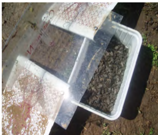
Slika 3. Feromonski mamac za repinu pipu

Repina pipa štetnik je koji se vrlo teško suzbija insekticidima. Zbog specifične građe i velike proždrljivosti pipe, često se provode višekratna tretiranja (Bažok i sur., 2012.). Zavod za poljoprivrednu zoologiju Agronomskog fakulteta Sveučilišta u Zagrebu dvama je projektima proveo istraživanje kojim je utvrđena mogućnost suzbijanja repine pipe agregacijskim feromonima na velikim površinama (Drmić i sur., 2017.). Cilj masovnog ulova bio je spriječiti migraciju odraslih sa starih na nova repišta i spriječiti štete na novim repištima. Feromoni su postavljeni na sva stara repišta na području od 6 km 2 . Istraživanja su provedena tijekom četiri godine, od 2012. do 2015. godine, a istraživano je područje u 2014. godini prošireno za dodatnih 8,8 km 2 , na ukupno 14,8 km 2 . Svake je godine masovni ulov repine pipe proveden postavljanjem feromonskih mamaca (slika 3) na sva polja na kojima je prethodne godine bila zasijana šećerna repa (stara repišta).