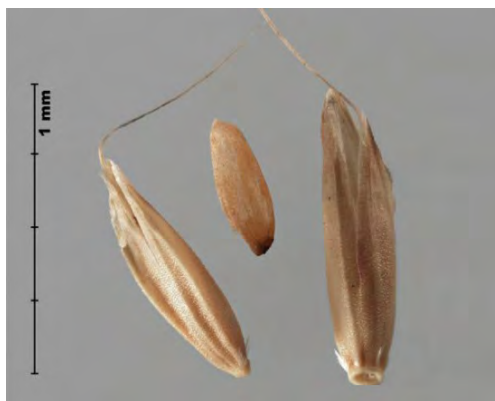
Slika 1. Izgled sjemena korovne vrste Alopecurus myosuroides

Figure 1. Alopecurus myosuroides seed