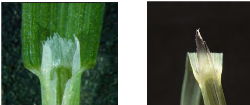
Slika 3. Nazubljeni jezičac vrste Alopecurus myosuroides (lijevo) i duguljasti i razdijeljeni jezičac vrste Apera spica-venti (desno)

U fazi nicanja mišjeg repka u polju se često može zamijeniti sa slakoperkom jer su obje vrste učestali korovi žitarica. Za početnu pomoć prilikom determinacije dobro je poznavati tip tla na kojemu se uzgaja pojedini usjev. Mišji repak češće se pojavljuje na teškim, glinastim tlima s visokim sadržajem vode, a slakoperka uglavnom niče na lakšim i pjeskovitim tlima. Prvi je list koji izlazi iz koleoptile (kožasta ovoja) zelenkasto-ljubičaste boje kod obje vrste, te ih na temelju toga nije moguće razlikovati. Ipak, vidljive su razlike u širini prvog lista, pa tako slakoperka za razliku od mišjeg repka ima uži (>1 mm) prvi list, a kod mišjeg repka prvi je list širi (3 mm). Razvojem prvog lista, na dijelu gdje vlat prelazi u list vidljivi su organi za determinaciju: uške, rukavac i jezičac. A. spica-venti i A. myosuroides ne posjeduju uške, ali obje posjeduju otvoren rukavac. Najpouzdanija je stoga determinacija na temelju oblika i izgleda jezičca. Tako je kod slakoperke on ušiljen sa zupčastim vrhom te razdijeljen po sredini, a kod mišjeg je repka kraći te pilasta ruba (slika 3) (Angelini i Viggiani, 2005.).