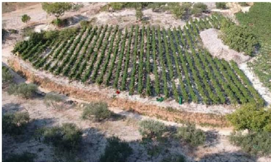
Slika 1. Vinograd u općini Postira/ Picture 1. Vineyard in Postira Municipality