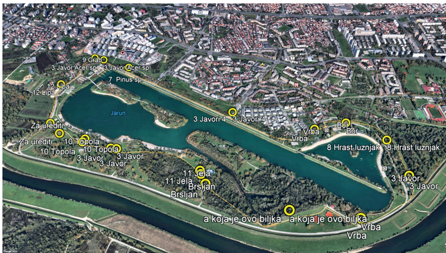
Slika 2. Orijeatcijska karta s ucrtanim drvenastim biljkama uz rolersku stazu na Jarunu (Martinis, 2018.)