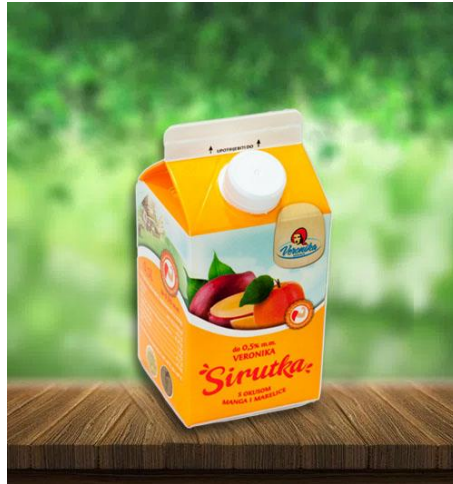
Slika 2.2.4. Sirutka s okusom manga i marelice

U Hrvatskoj aromatizirane sirutke proizvode mljekara Meggle i Veronika. Problem korištenja sirutke u proizvodnji napitka duljeg roka trajanja je stvaranje taloga zbog denaturacije proteina sirutke i taloženja mineralnih tvari (Tratnik, 2012.).