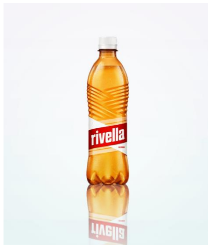
Slika 2.2.3 Rivella

Izvor: https://www.lattella.at/en/about-lattella - pristup 21.02.2024.