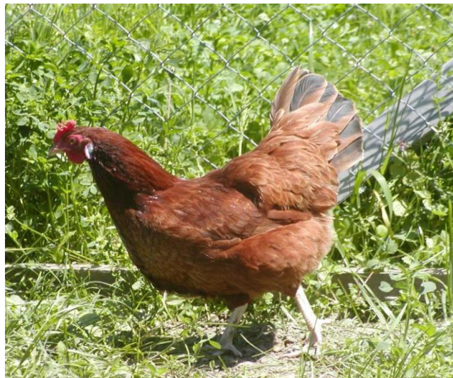
Slika 2. Crveni soj

Crni soj - Crni soj karakterizira posve crna boja perja, metalnog sjaja i kod kokoši i kod pijetlova (Slika 3).