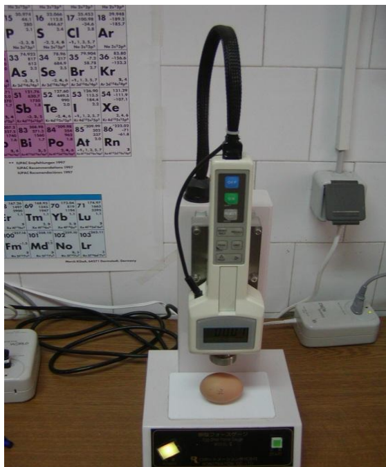
Slika 8. Uređaj za određivanje čvrstoće ljuske