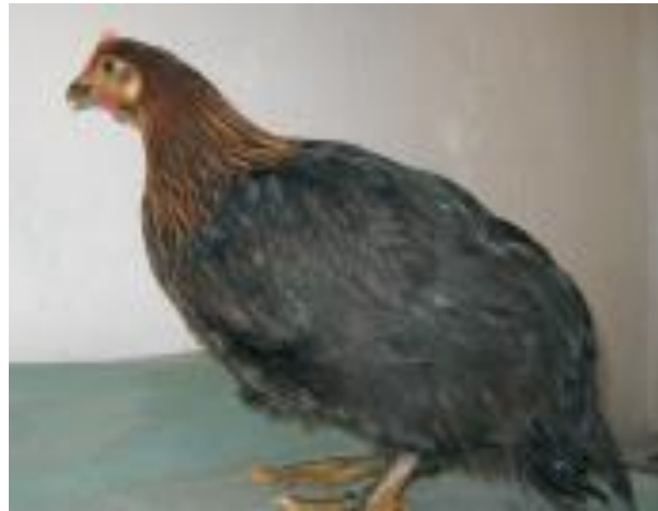
Slika 5. Crno-zlatni soj

Prepoznajući značaj kokoši hrvaticice kao izvorne pasmine peradi Sabor Republike Hrvatske donio je odluku o isplati novčanih poticaja za svaku uzgojno valjanu životinju. Djelatnici Hrvatske poljoprivredne agencije (HPA) vrše umatičavanje rasplodnih jata kojeg čini jedan pijetao i do deset kokoši istog soja, a za svaku je rasplodnu životinju moguće ostvariti novčani poticaj u iznosu od 60,00 kn. Uzgajivači su dužni umatičeno jato držati u uzgoju godinu dana, pratiti njihove proizvodne pokazatelje te ih u obliku očevidnika dostavljati u HPA. Ako na gospodarstvu ima umatičeno više jata kokoši hrvatica onda se moraju držati fizički odvojeno da bi se njihovi proizvodni rezultati mogli pratiti zasebno. U 2005. godini u Hrvatskoj je bilo oko 2000 jedinki. Tijekom 2008. godine upisano je 35 rasplodnih jata kokoši hrvaticice sa 361 kljunova, a tijekom 2009. godine registrirano je 40 rasplodnih jata s 389 kljunova. Izbor matičnih životinja provode djelatnici HPA-e, kad su životinje stare najmanje 18 tjedana. Sve rasplodne muške i ženske jedinke obilježavaju se trajnim nožnim prstenom s utisnutim matičnim brojem (HPA). U Tablici 5 prikazan je broj umatičenih kokoši Hrvatica po županijama u Republici Hrvatskoj u 2008., 2009. i 2010. godini.