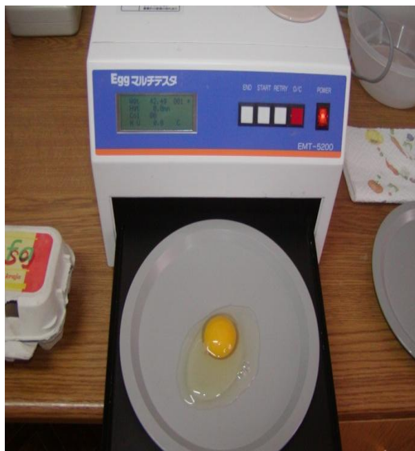
Slika 9. Instrumentalno određivanje kvalitete jaja

Radi utvrđivanja fenotipskih karakteristika utvrđene su tjelesne izmjere kokoši i pijetlova (Slika 7). Utvrđivanje fenotipskih obilježja provedeno je po metodi koju je opisao Kodinetz (1940) na način: