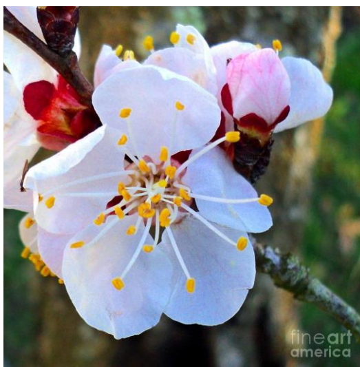
Slika 2. Cvijet marelice