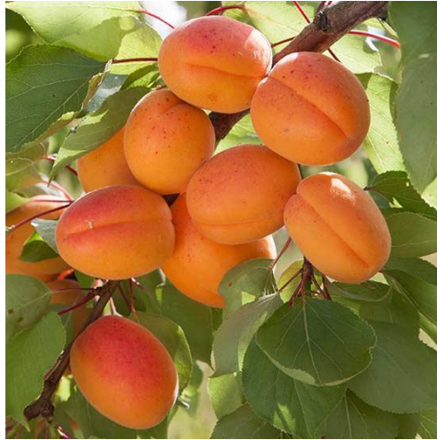
Slika 3. Plod marelice