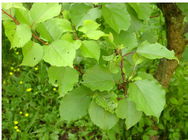
Slika 1. List marelice