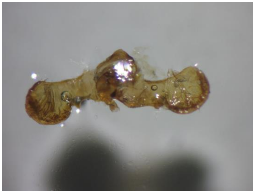
Slika 9. Spolni organ šljivinog savijača