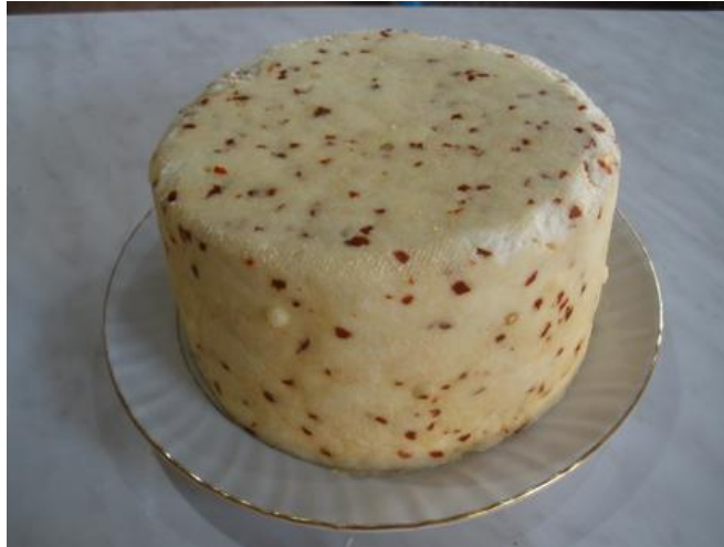
Slika 3.3. Kuhani sir sa usitnjenom crvenom paprikom

( https://www.savjetodavna.hr/vijesti/12/4266/demonstracije-izrade-sireva/ ).