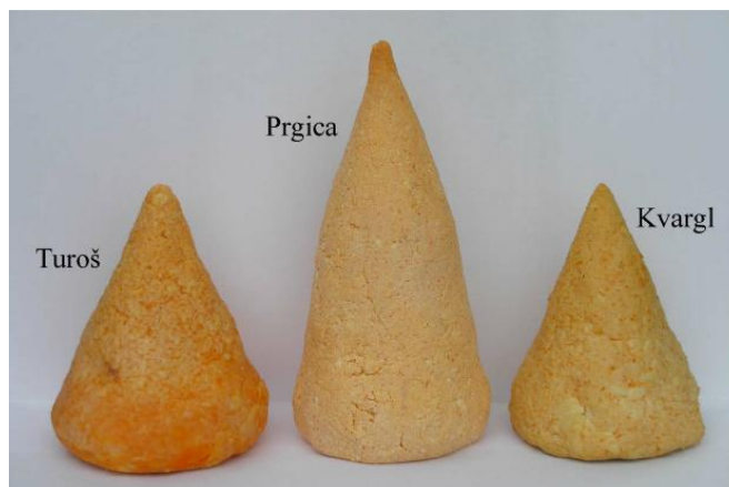
Slika 3.2. Sirevi turoš, prgica i kvargl

Valkaj (2015.) je na temelju istraživanja sira turoša, prgice i kvargla utvrdio razliku među njima. U proizvodnji turoša koriste se veće količine crvene mljevene paprike i soli, a i provodi se duže sušenje sira. (Slika 3.2.)