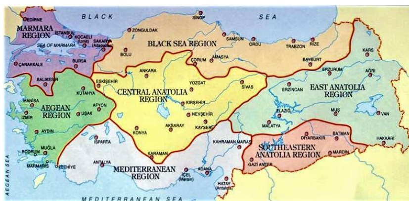
Slika 5.4.1.1. Turska regija Anatolija – područje proizvodnje tulum sira

Prema Tudor Kalit i sur. (2010.) u Turskoj postoji veliki broj sireva koji zriju u životinjskoj koži. Tulum sir najpoznatija je vrsta sira u turskoj koji zrije u životinjskoj koži. Postoji nekoliko varijanti tulum sira kao što su erzincan (savak) tulum, divle tulum i cimi tulum sir. Erzincan (savak) tulum sir najpoznatija je varijanta tulum sira. Danas se njegova proizvodnja odvija u svakoj regiji u Turskoj. Ime ovog sira potječe od plemena Savak, nomadskog naroda koji je u prošlosti obitavao na području istočne Turske, točnije u provinciji Erzincan u regiji Anatoliji (Slika 5.4.1.1.) (Ceylan i sur. 2007.). Tulum sir tradicionalno se proizvodio i prodavao na seoskim lokalnim tržnicama u Turskoj (Sert i sur. 2014.). Ceylan i sur. (2007.) navode da se proizvodnja do danas zadržala u manjim mljekarama i obiteljskim gospodarstvima korištenjem tradicionalnih metoda, dok se prema Sertu i sur. (2014.) modernim metodama proizvodnje koristi vrlo mali broj proizvođača. Riječ je o popularnoj vrsti sira u Turskoj, no tehnologija proizvodnje još uvijek nije standardizirana.