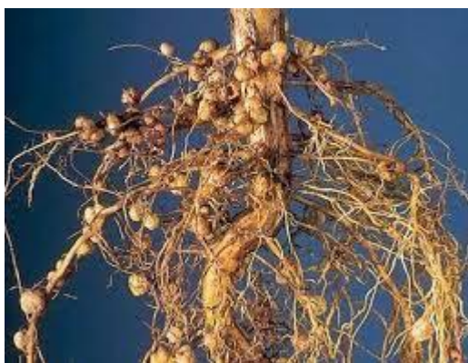
Slika 2.1. Kvržice na korijenu soje

Korijen soje sastoji se od jakog vretenastog korijena i velikog broja sekundarnog korijenja koji se razvijaju na različitim dubinama tla i velike su apsorpcijske moći. Glavni korijen dopire do 60 cm dubine, a postrano korijenje do 150 cm (Rapčan, 2014.) Ipak, glavnina korijenovog sistema nalazi u gornjem dijelu tla, na dubini 15 - 30 cm (Vratarić, 1986). Na korijenu soje razvijaju se kvržične bakterije vrste Bradyrhizobium japonicum koje simbiotskim odnosom s biljkom sebi osiguravaju ugljikohidrate, a biljku opskrbljuju dušikom vežući atmosferski dušik i pretvarajući ga u biljci dostupan amonijski oblik. Najviše se kvržica razvija na glavnom korijenu i u plićem sloju. Aktivnost kvržica traje 50 - 60 dana nakon čega one odumiru. Na slici 2.1 prikazan je korijen soje s dobro razvijenim kvržicama.