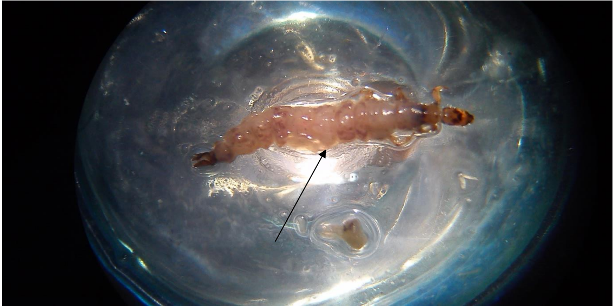
Slika 8. Mikroskopirana ličinka kukca iz reda Trichoptera