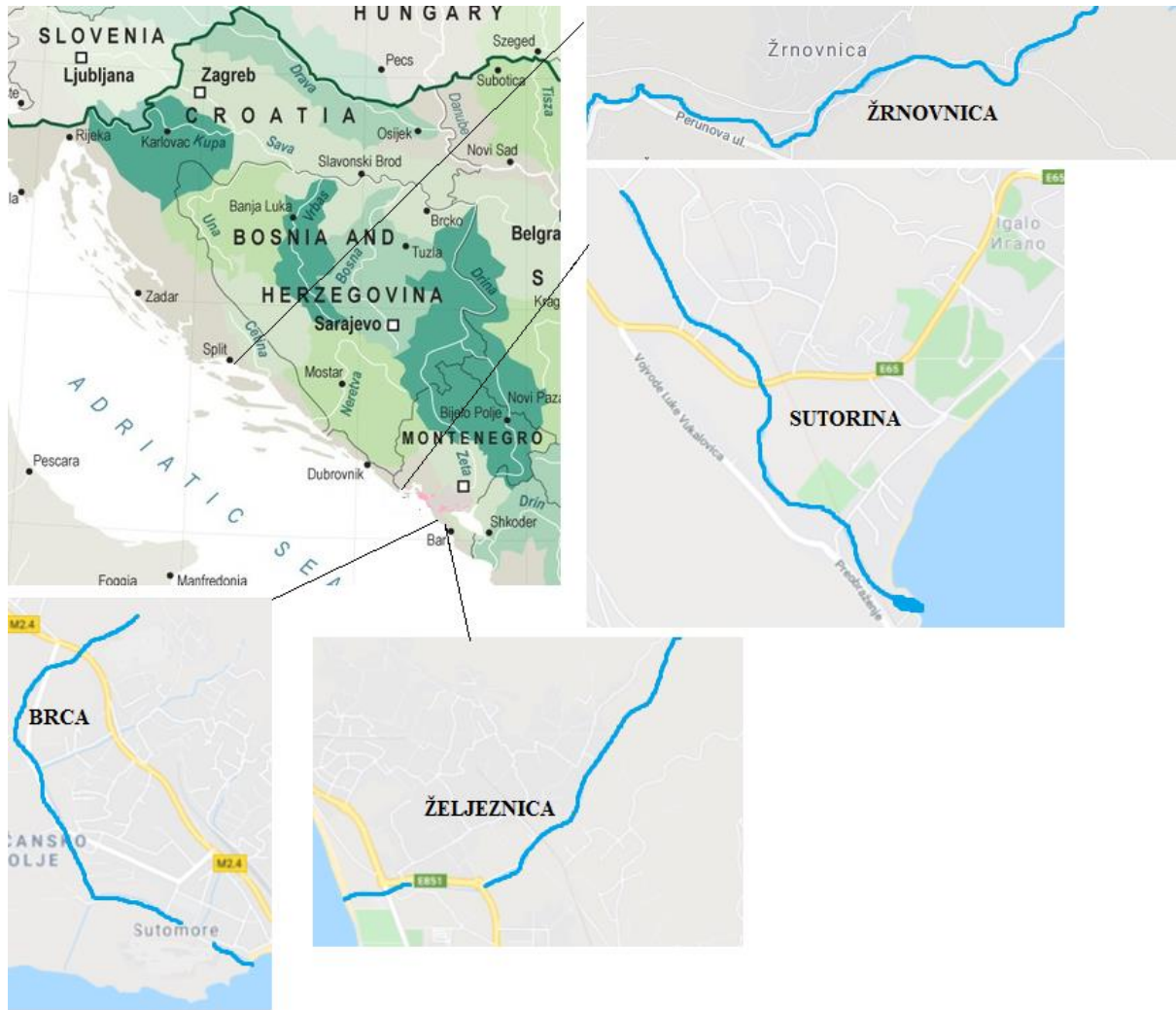
Slika 3. Lokacije uzorkovanja jegulje (Rijeke hrvatske, 2020; Google Maps, 2020a; 2020b; 2020c; 2020d)

Istraživanje je provedeno tijekom dana u proljeće, u tokovima triju krških rijeka Crne Gore, u rijeci Sutorini, Brca i Željeznici te u gornjem toku rijeke Žrnovnice u Hrvatskoj (Slika 3).