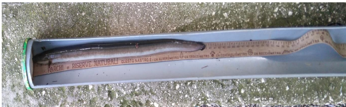
Slika 4. Mjerenje dužine jegulje ihtiommetrom

Jedinke jegulja su lovljene tijekom 4.6.2016. (Sutorina, Brca i Željeznica) i 2.10. 2016 (Žrnovnica) godine uređajem za elektroribolov (Hans Grassl), tehnikom kontinuiranog prolaza uzduž riječne obale pri čemu je obuhvaćena površina uzorkovanja od 100 m dužine u svakoj rijeci. Totalna dužina (TL) uzorkovanih jedinki izmjerena je ihtiommetrom s točnošću od 0,5 cm (Slika 4), dok je masa izmjerena vagom s preciznošću od ± 0,001 g. Na osnovi dužinsko-masениh vrijednosti, izračunat je Fultonov faktor kondicije (CF) koji pokazuje opće stanje riba i promjene koje se odvijaju zavisno od lokacije i fizioloških ciklusa u životu riba. Jegulje su stavljene u vrećice i transportirane u hladnjak ribarskog laboratorija Zavoda za ribarstvo, pčelarstvo, lovstvo i specijalnu zoologiju Agronomskog fakulteta Sveučilišta u Zagrebu.