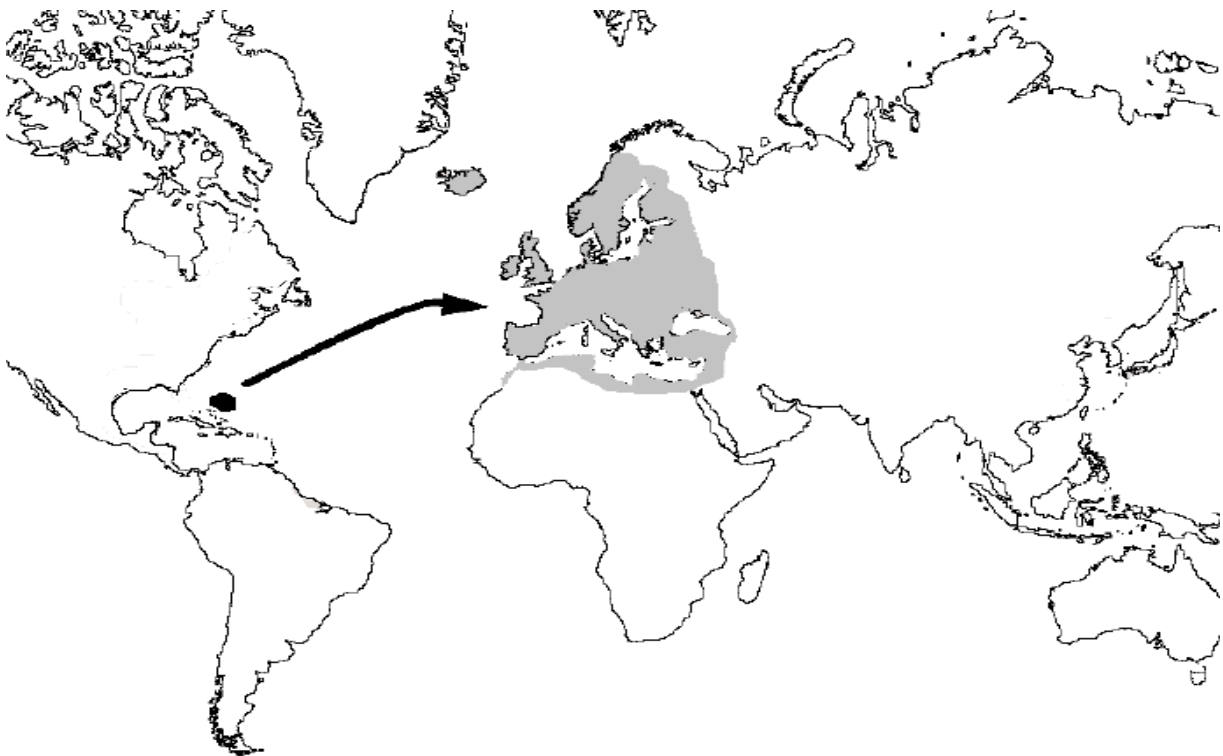
Slika 1. Rasprostranjenost Europske jegulje nakon mrijesta u Sargaškom moru (Ringuet i sur., 2002).