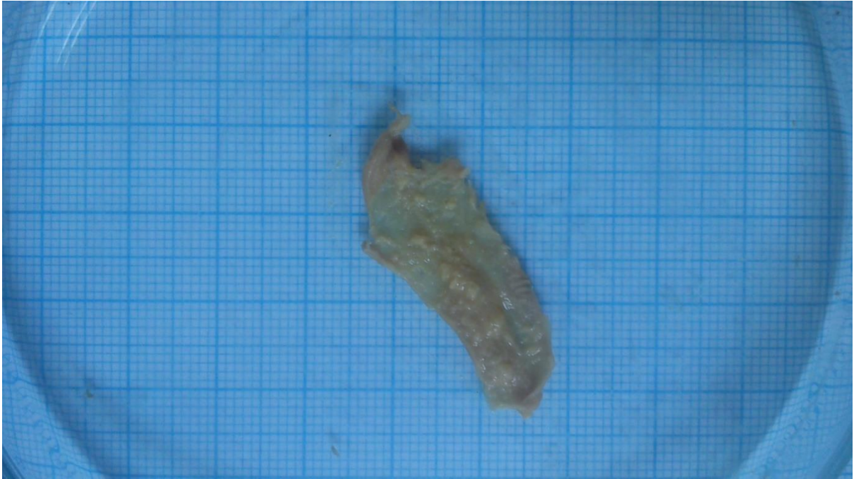
Slika 6. Detritus unutar disekciranog probavila