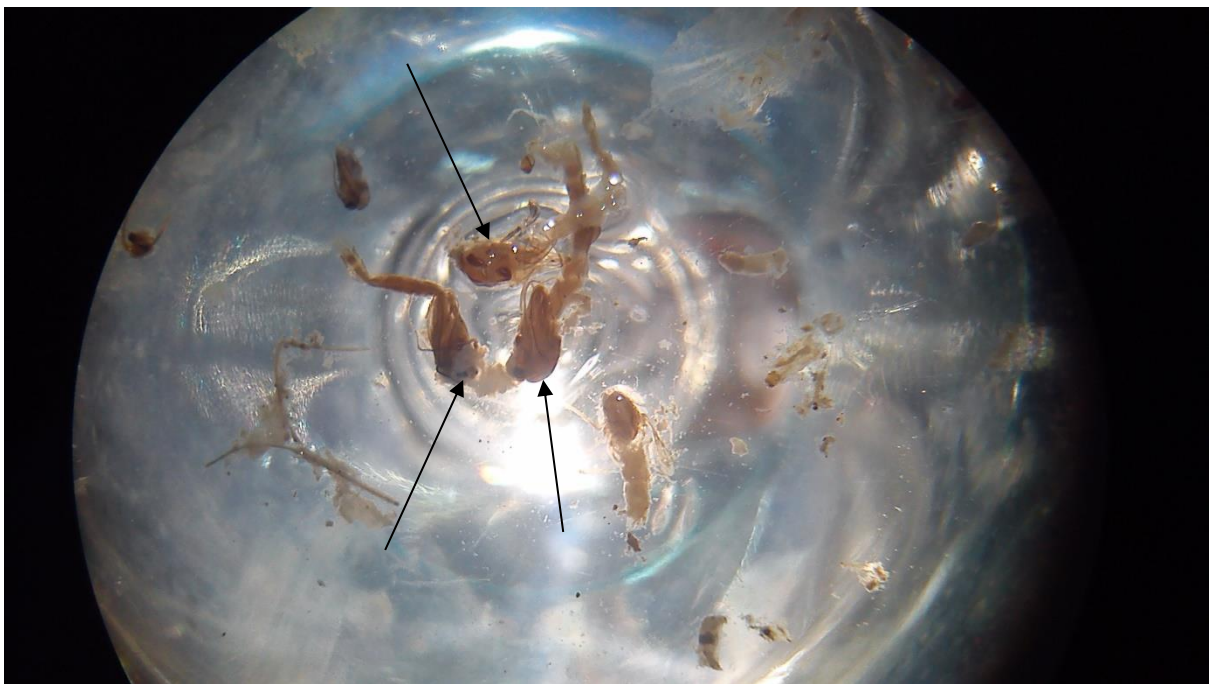
Slika 9. Mikroskopirane kukuljice kukaca iz reda Diptera