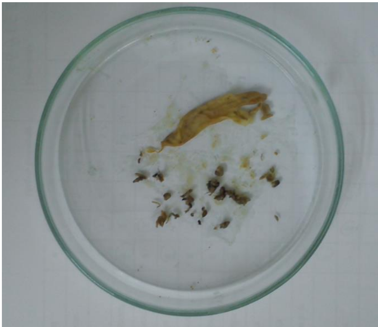
Slika 5. Izdvojene svojte nakon disekcije probavila

obzirom da su ga sačinjavale različite razgrađene biljke koje tvore biljnu masu, koja se nije mogla sistematski kategorizirati (Slika 7).