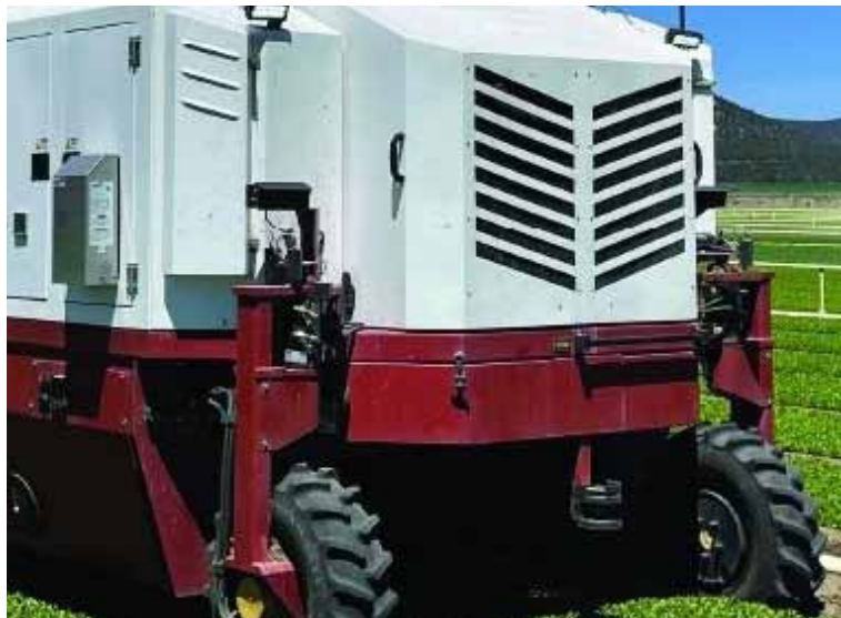
Slika 10. Robot za suzbijanje korova pomoću lasera tvrtke Carbon Robotics

( Amaranthus retroflexus L.) u fazi rasta prvog lista. Primijenjena su tri različita položaja lasera i tri veličini laserske točke 3.0, 4.2 i 6.0 mm. Istraživanja su pokazala da se minimalna energija potrebna za uništavanje korova kretala od 10 do 71 J po korovu, a utvrdili su važnost preciznog pozicioniranja lasera, budući da je model oštećenja pokazao potrebno povećanje energije od 1.3 J za svakih 1% gubitka u točnosti pozicioniranja. Američka robotička tvrtka Carbon Robotics razvila je svoju treću generaciju autonomnog robota koji koristi robotiku, umjetnu inteligenciju i lasersku tehnologiju velike snage za precizno kretanje kroz usjeve te za prepoznavanje i uklanjanje korova (Slika 10). Kamere visoke razlučivosti prenose slike u stvarnom vremenu na ugrađeno superračunalo koje pokreće modele strojnog vida za prepoznavanje usjeva i korova. Lasersko uklanjanje korova može se provoditi danju i noću u svim vremenskim uvjetima.