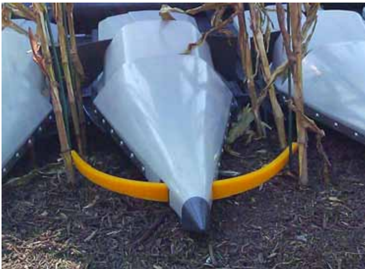
Slika 1. Primjer primjene taktilnog senzora za orijentaciju prema usjevu

Figure 1. An example of tactile sensor application for the orientation towards crop