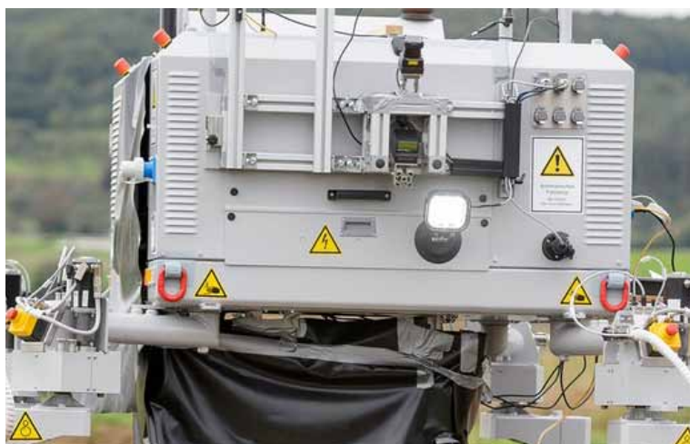
Slika 6. Integrirani višenamjenski robot za primjenu u poljoprivredi BoniRob

Neki roboti imaju mogućnost uklanjanja korova i kemijskim i mehaničkim sustavom. Integrirani višenamjenski robot za primjenu u poljoprivredi pod nazivom BoniRob razvijen je kao zajednički projekt Sveučilišta Osnabruck, razvojne tvrtke DeepField Robotics, tehnološke tvrtke Bosch i proizvođača poljoprivrednih strojeva Amazone (Slika 6).