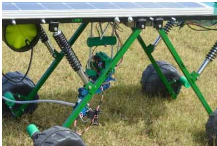
Slika 8. Robot za suzbijanje korova vodenom parom i laserskim uređajem Mapplics GBOT

statak veliki utrošak energije koja je potrebna za zagrijavanje vode (Slaughter i sur., 2008). Glavne komponente ovog sustava su spremnik za vodu, crpka za vodu, parni kotao, generator pare i mlaznice za usmjeravanje pare. Sustav djeluje tako da nakon što sustav strojnog vida prepozna korov, pokretna ruka postavlja mlaznicu iznad korovske biljke i ispušta određenu količinu vodene pare na biljku. Giles i sur. (2005) modificirali su sustav preciznog apliciranja koji su razvili Lee i sur. (1999) za primjenu tekućina zagrijanih do 200 °C. Sustav je dizajniran za robotsku kontrolu korova korištenjem precizne primjene grijanih organska ulja za uništavanje korova s uljima na različitim temperaturama. Korištenjem ulja temperature 177 °C gotovo svi korovi bili su uništeni, dok se učinkovitost smanjila sa smanjenjem temperature i utvrđeno je da je minimalna temperatura pri kojoj je učinkovitost sustava bila pouzdana 150 °C. Uspjeh primjene vodene pare za uništavanje korova ovisi o građi korova i visini stabljike. Vruća para izvrsno je sredstvo za uništavanje širokolisnih korova različitih veličina, dok je nešto slabije djelovanje na travne korove i višegodišnje korove (Leskošek i sur., 2003). Za poboljšanje učinkovitosti, sustav za suzbijanje korova vodenom parom se može kombinirati s nekim drugim sustavom, pa je tako argentinska tvrtka Mapplics razvila robota GBOT koji je uz sustav za suzbijanje korova vodenom parom opremljen i laserskim uređajem za suzbijanje korova (Slika 8).