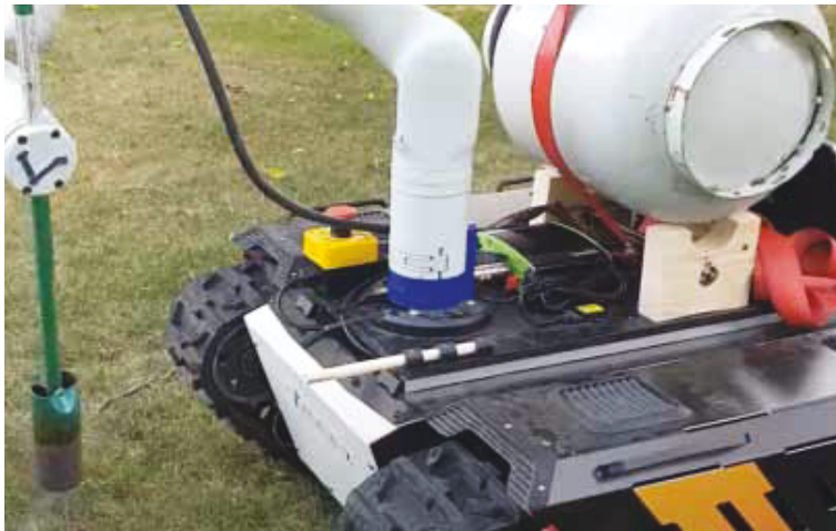
Slika 7. Robot za suzbijanje korova plamenom Ultimate Weed Killing Robot