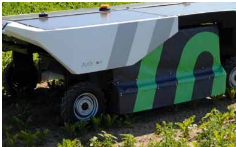
Slika 4. Robot za suzbijanje korova selektivnom kemijskom aplikacijom EcoRobotix Avo Figure 4. Robot for weed control by selective chemical application EcoRobotix Avo