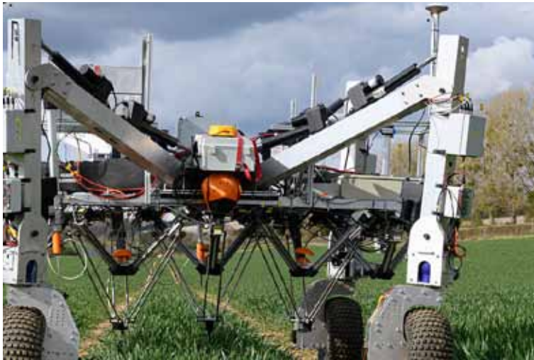
Slika 9. Robot za suzbijanje korova električnim pražnjenjem Dick tvrtke Small Robot Company

ispod 50 do iznad 90%, a razlike između eksperimenata mogu djelomično objasniti varijacije u svojstvima različitih vrsta korova, naponu i metodama tretiranja, te vlažnosti tla (Slaughter i sur., 2008). Blasco i sur. (2002) su primijenili električno pražnjenje napona 15 kV i jačine struje 30 mA u trajanju od 200 ms i taj sustav je bio u stanju eliminirati 100% malih korova, ali kod većih biljaka su samo zahvaćeni listovi pokazali neku vrstu štete. Britanska tvrtka Small Robot Company konstruirala je robot za suzbijanje korova u ratarskim usjevima električnim pražnjenjem koji uništava širokolisne korove identificirane pomoću prepoznavanja uzoraka, a pokreću ga baterije američkog proizvođača Tesla (Slika 9). Radi sigurnosti robot ima laserske senzore za otkrivanje prepreka i isključuje se u slučaju da naiđe na nešto neočekivano. Kada njegov sustav strojnog vida otkrije korov u usjevu, približi mu elektrodu i električnim udarom od 8000 V ga uništava.