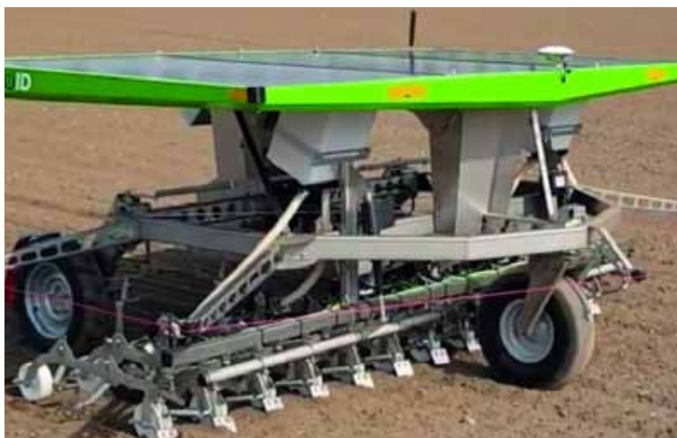
Slika 5. Robot za mehaničko suzbijanje korova FarmDroid FD20