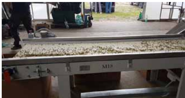
Slika 9. Revizijski transporter Figure 9. Revisory conveyor

Revizijski transporteri namijenjeni su za inspekciju i organoleptički pregled raznih vrsta materijala. Na kraju revizijskog transportera nalazi se pneumatski separator s lomljenim trakastim transporterom, čija je funkcija klasiranje glavica po kvaliteti te odvajanje prašine. Tako klasirana glavica kontrolira se na revizijskom transporteru nakon čega se obrađena roba prve klase pakira izravno u kutije za skladište gotove robe.