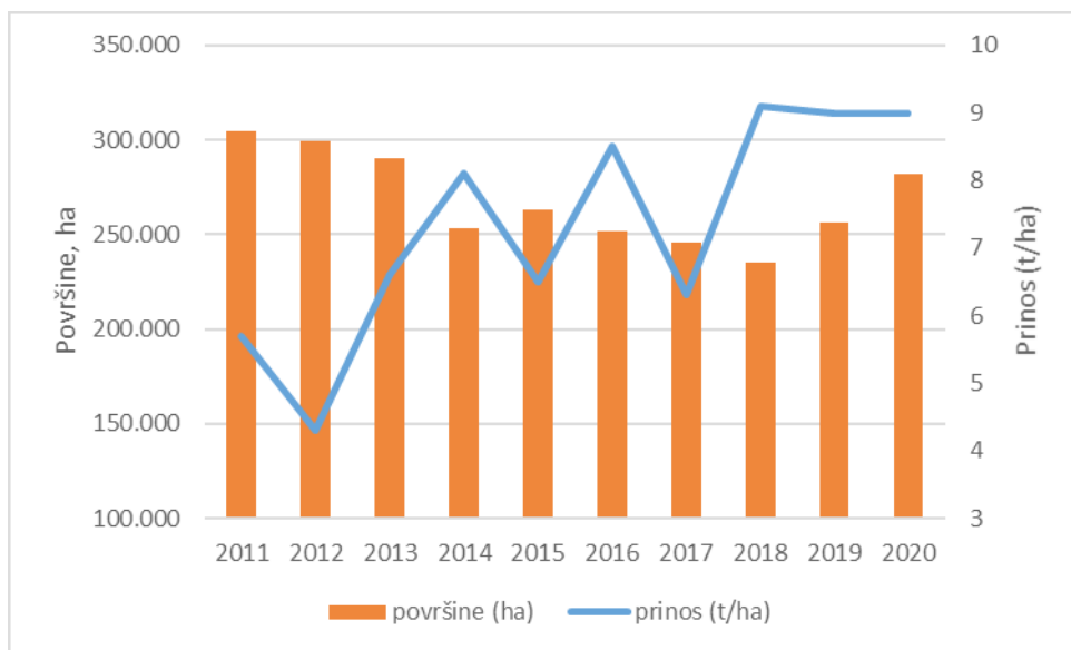
Grafikon 2. Površine i prinosi kukuruza u Hrvatskoj (2011.-2020.)

Najzastupljenija žitarica na proizvodnim površinama u Hrvatskoj je kukuruz. U proteklih deset godina (2011.-2020.) prosječno je godišnje 268,1 tisuća hektara pod ovom kulturom. Najviše je zasijanih površina bilo 2011. kada je kukuruz bio prisutan na 305 tisuće hektara dok je najmanje kukuruza u plodoređu bilo 2018. uz proizvodnu površinu od 235 tisuće hektara. U većoj mjeri od oscilacija proizvodnih površina razvidne su oscilacije prinosa kukuruza koji se kretao od 4,3 t/ha u 2012. do 9,1 t/ha u 2018.