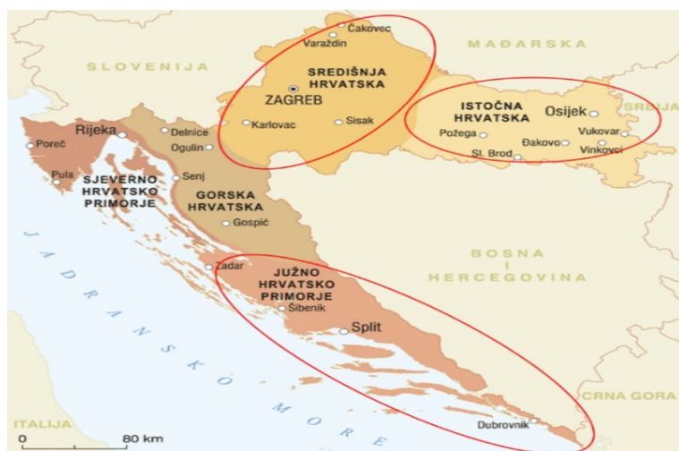
Slika 1. Prikaz područja istraživanja

Istraživanje je provedeno za područje sjeverozapadne Hrvatske, Slavonije i Dalmacije na temelju literature (Nikolić et al., 2014). Napravljen je popis invazivnih biljnih vrsta koje su zabilježene na području istraživanja. Biljne vrste, njihova znanstvena i narodna imena, rodovi te porodice navedene su u popisu flore abecednim redom unutar viših sistematskih kategorija. Za svaku biljnu vrstu navodi se životni oblik, porijeklo i način unosa, vrijeme cvatnje te područje rasprostranjenosti na kojima su zabilježene (Tablica 1). Životni oblici (H – Hemicryptophyta, T – Therophyta, G – Geophyta, P – Phanerophyta, N - Nanophanerophyta i Ch – Chamaephyta) prikupljenih biljnih vrsta određeni su prema Flora Croatica Database. Porijeklo biljnih vrsta označeno je kao: Sj. Am (Sjeverna Amerika), J. Am (Južna Amerika), Az (Azija), Af (Afrika). Način unosa može biti namjeran ili nenamjeran.