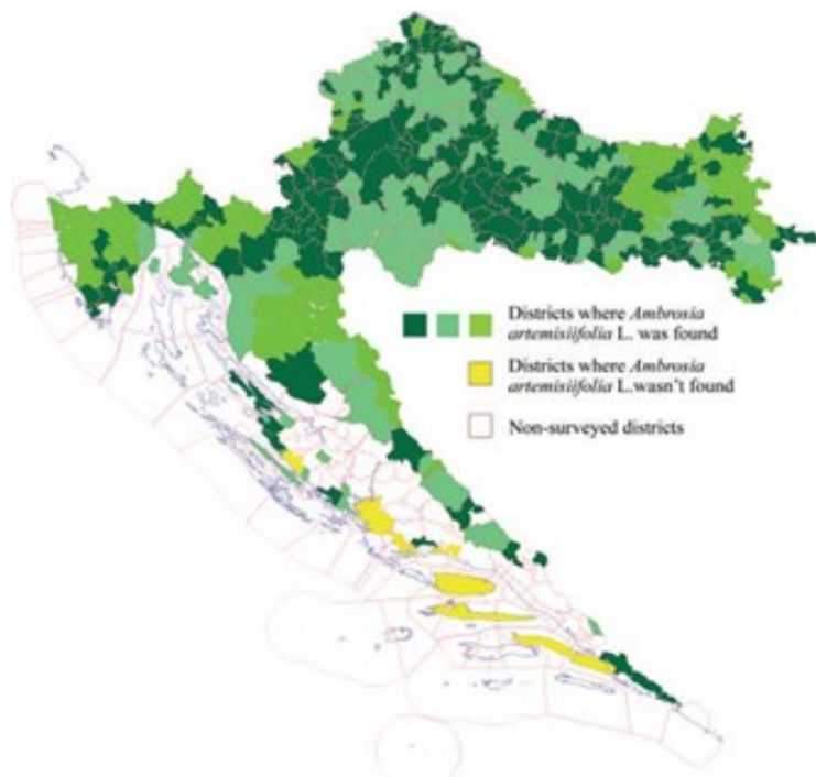
Slika 1. Rasprostranjenost ambrozije u Hrvatskoj od 2004. do 2006. godine (Izvor: Galzina et al., 2010).

Figure 1. Distribution of common ragweed in Croatia from 2004 to 2006 (Source: Galzina et al., 2010).