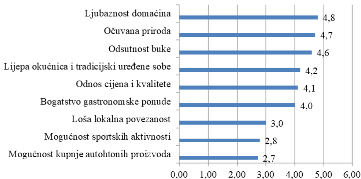
Grafikon 3. Čimbenici zadovoljstva boravkom na agroturističkom gospodarstvu

ponude. Loše ocjenjeni su lokalna povezanost, mogućnost sportskih aktivnosti i mogućnost kupnje autohtonih proizvoda (Grafikon 3). Prosječna ocjena ukupnog dojma boravka na gospodarstvu je 4,2.