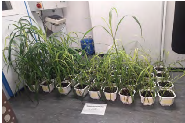
Slika 4. Rezistentna populacija divljeg sirka s lokaliteta Dubrovčak Lijevi tretirana linearno rastućim (od \frac{1}{2} do 64 x veća doza od registrirane) dozacijama herbicida foramsulfurona (gore), imazamoksa (sredina) i nikosulfurona (dolje)

Otkriće rezistentnih populacija u Republici Hrvatskoj velik je problem za cjelokupnu biljnu proizvodnju. Rezistentne populacije divljeg sirka potvrđene u usjevu kukuruza opasnost su i za ostale usjeve zakorovljene tom korovnom vrstom, a u kojima se koriste ALS herbicidi. Još su veći problem utvrđene rezistentne populacije ambrozije, i to iz nekoliko razloga. Prvo, ambrozija je najzastupljenija širokolisna korovna vrsta okopavinskih usjeva Hrvatske (Šarić i sur., 2011.). Drugo, za suzbijanje ambrozije u usjevu soje u post-emergence roku primjene nema alternativnih herbicida jer se suzbijanje donedavno obavljalo isključivo ALS herbicidima (okasulfuron, tifensulfuron i imazamoks). I treće, rezistentne populacije ambrozije svakako su potencijalni problem i u drugim okopavinskim usjevima gdje se redovito koriste ALS herbicidi (kukuruz, tolerantni suncokret, strne žitarice). Stoga je u daljnjim istraživanjima potrebno testirati te populacije na sve ALS herbicide koje se koristi u ratarskim i povrtnim kulturama.