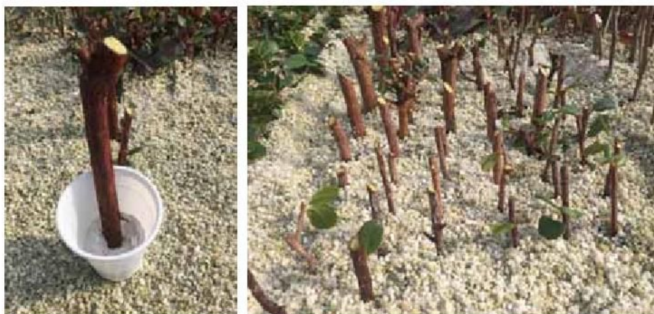
Slika 2. Tretiranje bazitonog dijela reznice planike indol maslačnom kiselinom (IBA, puder 3000 ppm) i stavljanje u supstrat na ožiljavanje

Duljina pripremljenih reznica iznosila je oko 15 cm. Bazitoni dio reznica tretiran je indol maslačnom kiselinom (IBA, puder 3000 ppm) i potom su reznice stavljene u supstrat za ožiljavanje (perlit) na tople stolove (Slika 2). Reznice su postavljene na razmak od oko 5x5 cm i na dubinu oko 5 cm. Ožiljavanje je trajalo 52 dana (Slika 3), uz konstantno praćenje temperature zraka (22-25 °C) i relativne vlažnosti zraka (od 80-95 %) koje se postizalo sustavom za orošavanje. Potom su reznice izvađene iz supstrata i utvrđen je razvoj kalusa (Slika 4), kao i postotak ožiljenih reznica, a jačina razvoja korijena koji je bio baziran na broju i duljini razvijenog korijena (Slika 5).