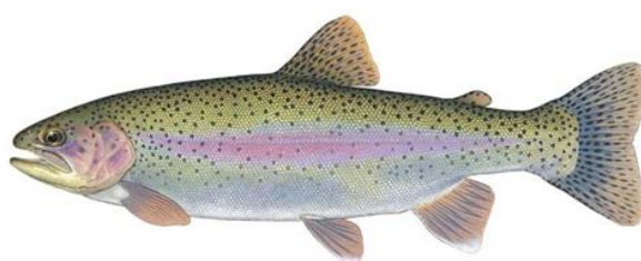
Slika 1: Kalifornijska pastrva ( Oncorhynchus mykiss )