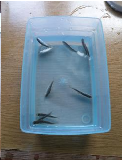
Slika 7: Mladunci pod narkotikom