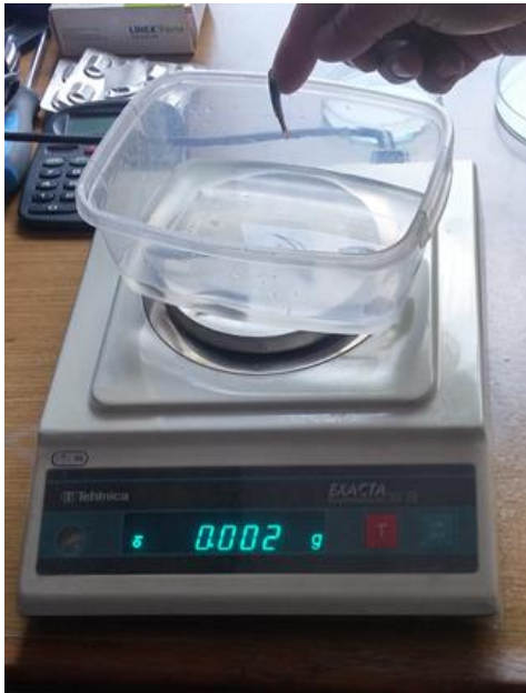
Slika 6: Elektronička vaga