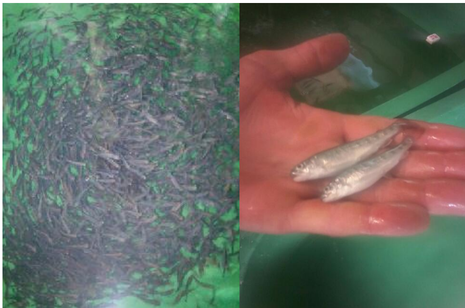
Slika 8: Mladunci stari približno dva mjeseca

Podaci o masi mladunaca unesini su u Excel tablice, te je izračunata prosječna masa jedinki ( \bar{x} ), zatim standardna devijacija (SD), 95% interval pouzdanosti, te maksimalna i minimalna masa jedinke za svaku skupinu. Također izračunata je i specifična stopa rasta za masu (SGRw) za svaku skupinu (1ABC I 2ABC) za četiri mjerenja po formuli: