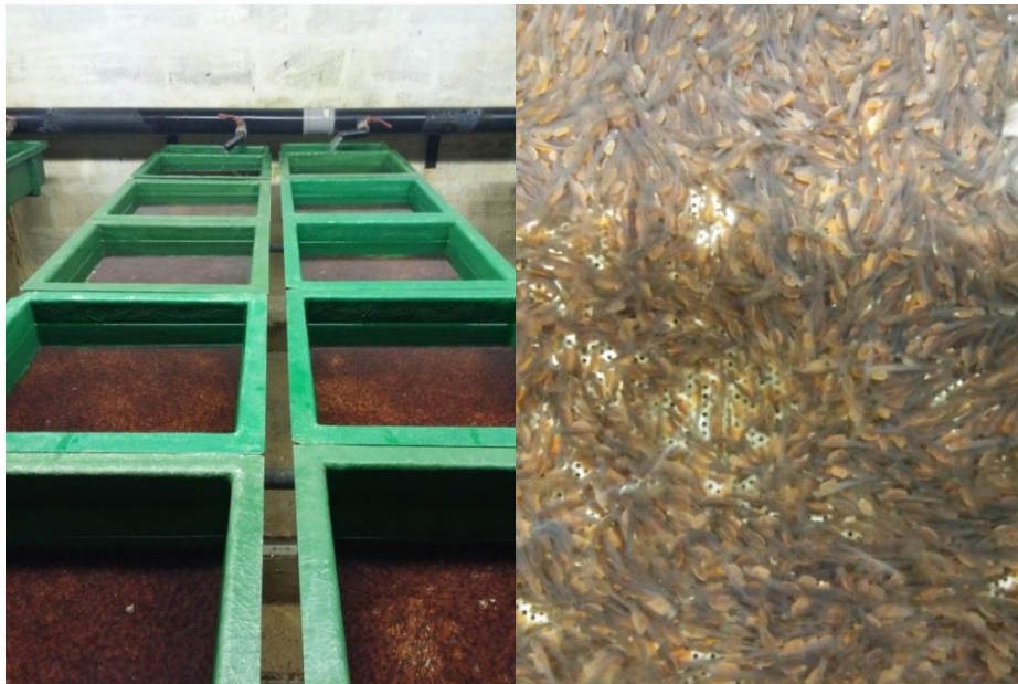
Slika 4: Ličinke u fazi mirovanja

U sljedećoj fazi ličinke (Slika 4) su se hranile preko viterusa, zadržavajući se na dnu ležnice. Prvih nekoliko mladunaca isplivalo je 9.4. te se počelo aktivno hraniti. Već sljedeći dan 10.4. obavljeno je odvajanje mladunaca koji su prvi isplivali, u tri bazena po 100 komada (1A, 1B i 1C). Isto tako zadnji mladunci koji su isplivali 14. 4. odvojeni su također u tri bazena po 100 komada (2A, 2B i 2C). Obje skupine mladunaca držane su u jednakim životnim uvjetima. Hranidba se odvijala ručno Biomar hranom za ribe granulacije 0,5 mm, 5-6 puta na dan ad libitum, kako su ribe rasle, granulacija se povećavala, a smanjivao se broj hranjenja u danu. Provođena je svakodnevna evidencija o broju uginulih ribica.