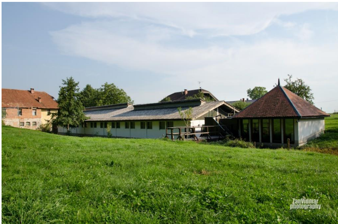
Slika 2: Ribogojnica Pšata

Pokus je provođen u slovenskoj Ribogojnici Pšata (Slika 2), koja je smještena na izvoru potoka Pšata kod Cerklja na Gorenjskem, a nalazi se u sklopu poduzeća Vodomec d.o.o. Dozvoljeno izdvajanje vode iz potoka Pšata je 70 l/s. Namjena ribogojnice je mrijest i uzgoj mlađi i mladunaca kalifornijske pastrve. Ribogoiilište ima odvojene bazene s maticama, prostor za mrijest, Cuger inkubatore, opremljena je sa 120 rotacijskih bazena, 2 betonska i 13 plastičnih bazena. Mrijestilište posluje s kapacitetom od 5 do 6 milijuna jaja godišnje. Ribogojnica Pšata, prva je u Sloveniji 2008. god. stekla status bez bolesti navedene od strane Europske unije. Također se uvozi ikra u razdoblju kada ikre nema dovoljno, ili kod nepovoljnih uvjeta za mrijest. Ribogoiilište je u suradnji s Biotehničkim fakultetom, te se ovdje vrše razni pokusi bitni za ribarstvo, kao i mogućnost odrađivanja prakse i praktičnih radova za studente.