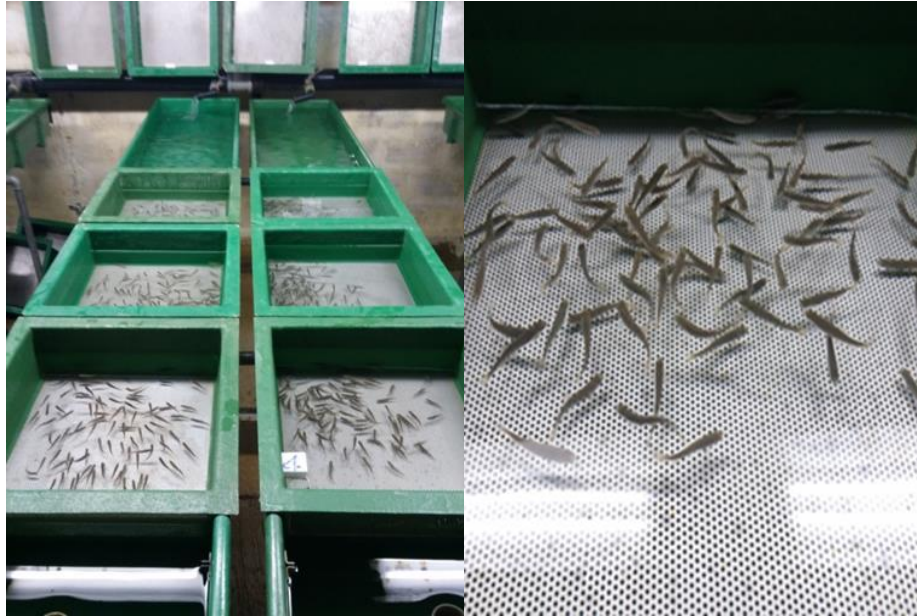
Slika 5: Mladunci stari približno mjesec dana

16.5. provedeno je pojedinačno vaganje po 20 komada nasumično odabranih mladunaca (Slika 6) iz svakog bazena (1A 1B 1B 2A 2B 2C), odnosno po 60 jedinki iz prve skupine (1ABC) kada su mladunci bili odvojeni 36 dana nakon početka aktivne faze i 60 jedinki iz druge skupine (2ABC) kada su mladunci bili odvojeni 32 dana nakon početka aktivne faze.