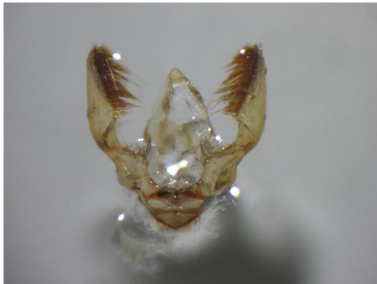
Slika 8. Spolni organ breskvinog savijača

Testisi (Slika 8) su izduženi sa mnogobrojnim dlakama. Testisi šljivinog savijača (Slika 9) su oblika „lopate“ sa karakterističnim roščićem na bazi.