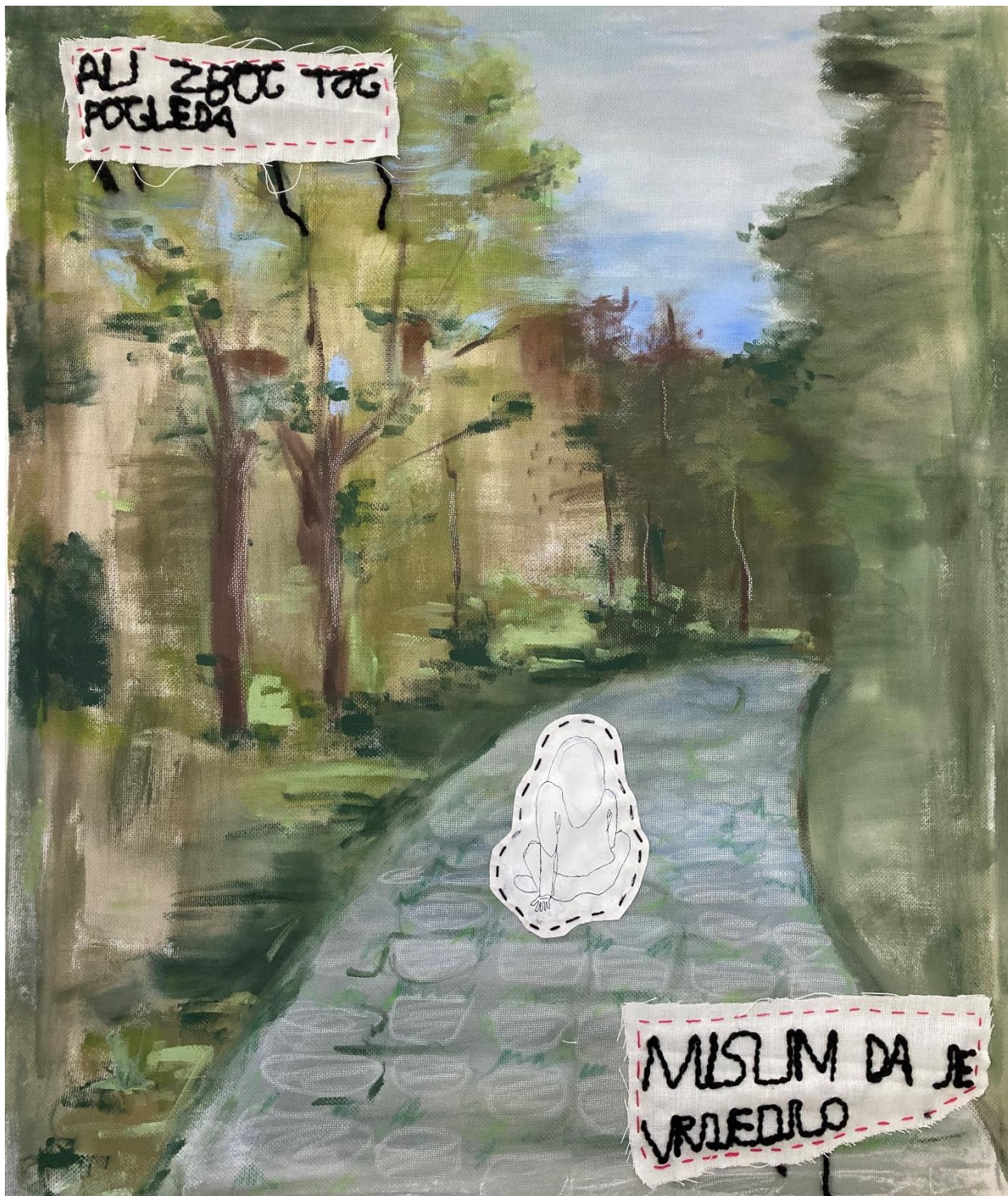
Strip „Kad se vraćam s faksa“ 2021., konac, papir, tkanina, akril, pastele na platnu, 100x90 cm