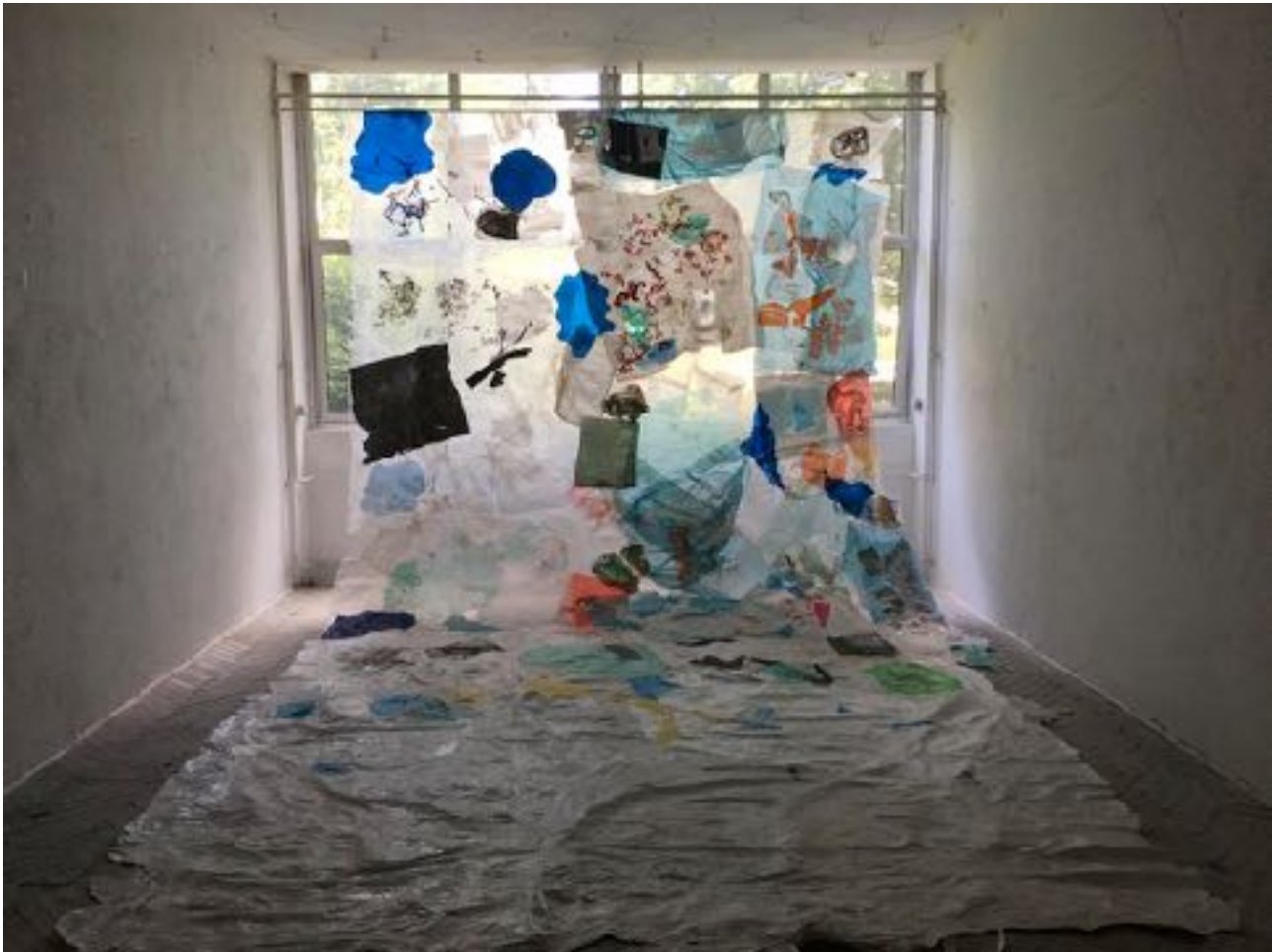
Sl. 17. 2021., 2021.

Svaki komadić višemetarske instalacije nastao je peglanjem, topljenjem, prešanjem i lijepljenjem odbačenih vrećica i industrijskih plastičnih folija. Dodatan element rada je njegov postav uz prozore i pozadinsko osvjetljenje prirodnim svjetlom. Svjetlo poništava, dodaje, otkriva i mijenja kompoziciju.