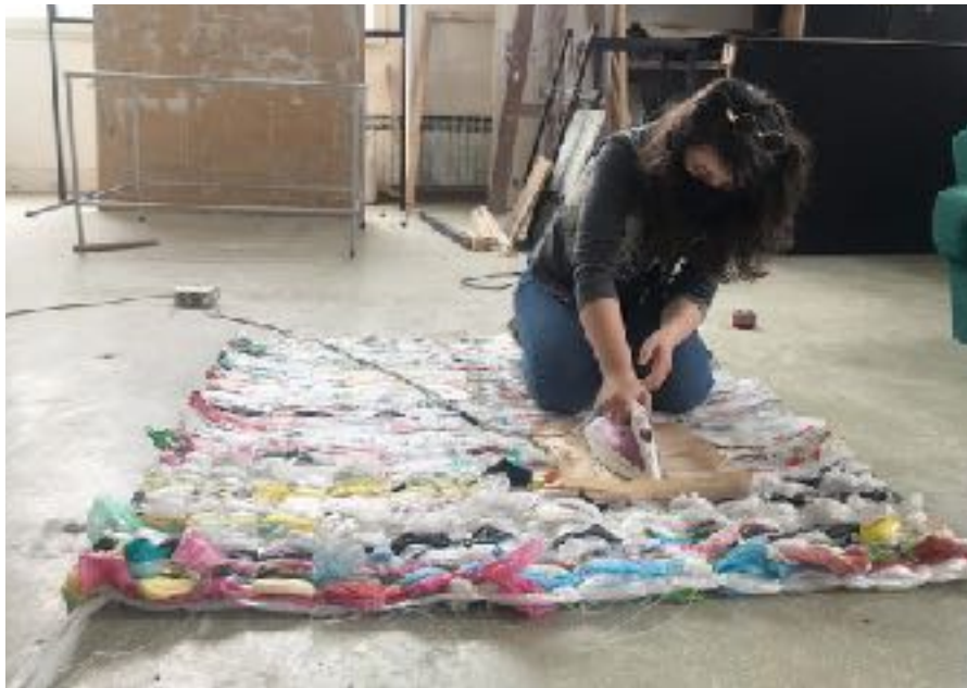
Sl. 9. Tkanica , 2019., izrada