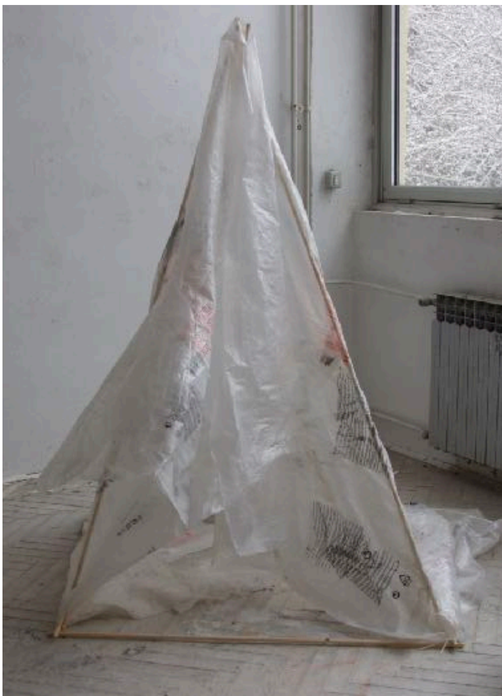
Sl. 12. Šator T - 01 , 2020.