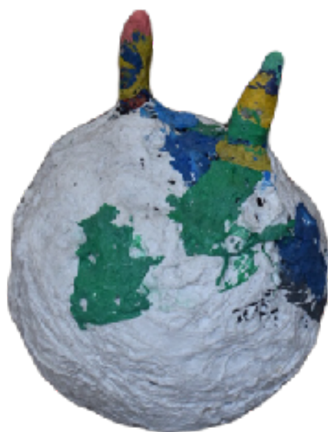
Sl. 18. Plastično igralište: Jo-jo lopta, 2020.

Izvedena po modelu igračke, promatrača može asociirati na dječju loptu na napuhavanje koja je namijenjena za skakanje, ali ova teška, nepravilna kuglasta tvorevina s dva roga lišena je funkcije skakanja. Ima “manu” i njome možemo samo ljuljati se na mjestu.