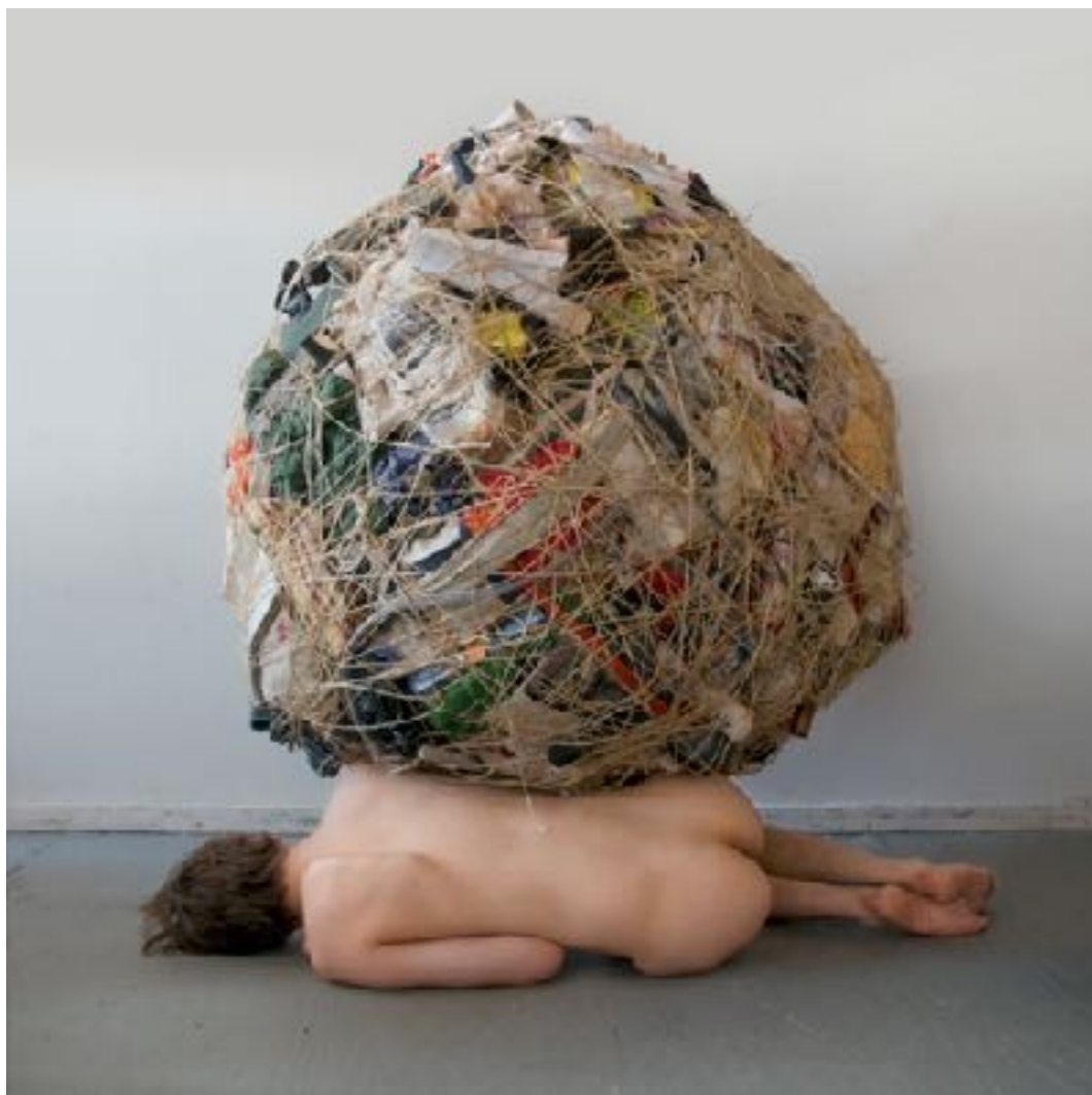
Sl. 2. Mary Mattingly, Život objekata , 2013.

Mary Mattingly američka je umjetnica koja obrađuje teme putovanja, doma, konzumerizma i ekologije. Svoje umjetničke akcije dokumentira i prezentira fotografijama. Život objekata jedan je od sedam radova iz serije Dom i svemir . Umjetnica je gomilala osobne predmete te ih je vezivala špagom, vukla ih je i postavljala u različite prostore, stvarajući narativ. Radovima se referira na mit o Sizifu, prevodeći ga u suvremeni kontekst hiperprodukcije i fenomena konzumerizma. 9