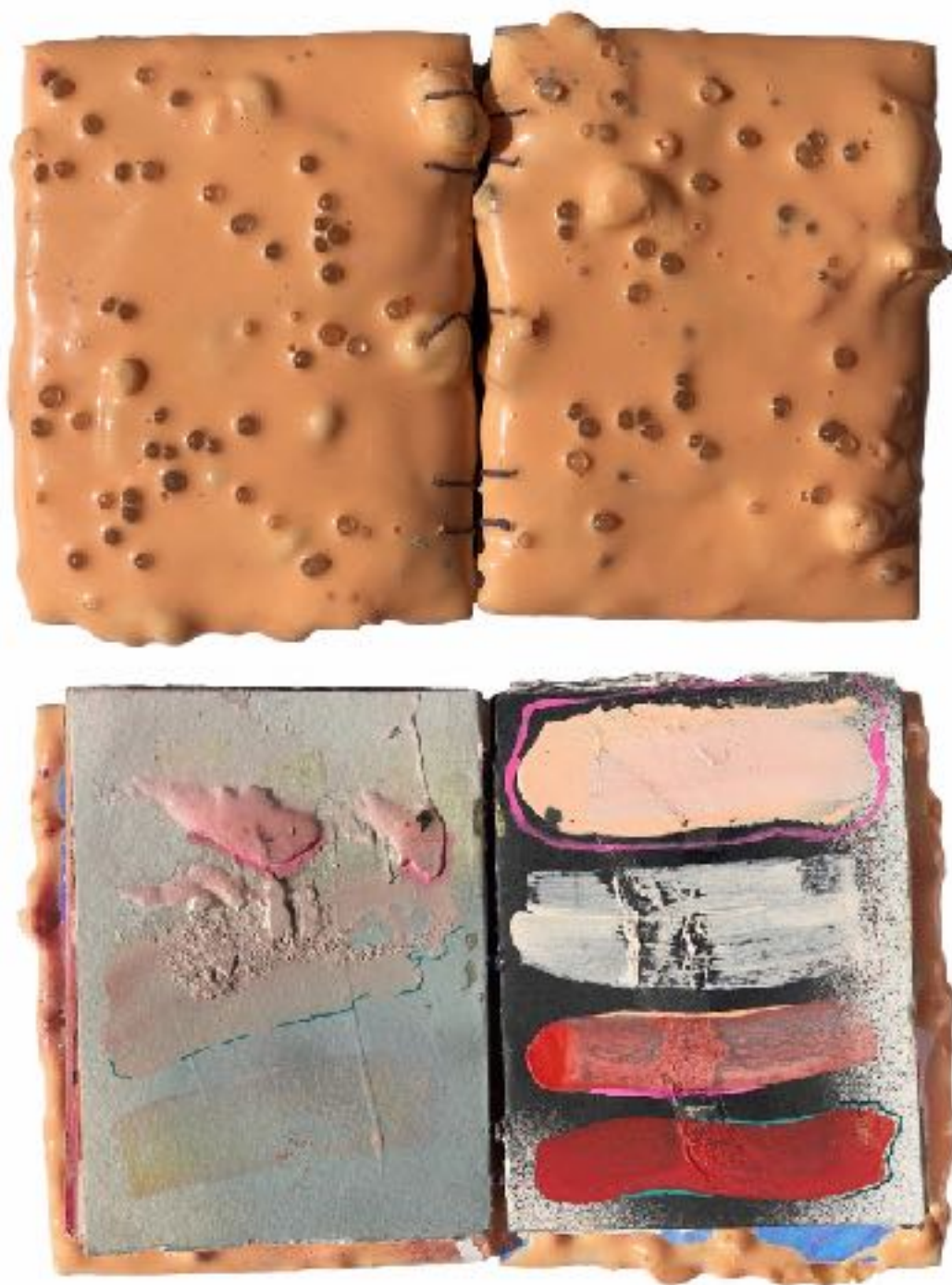
Sl. 5. Laura Soto, Sketchbook , 2018., detalj