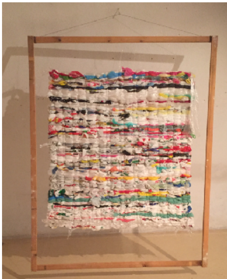
Sl. 10. Tkanica , 2019.