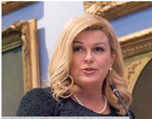
Predsjednica Republike Hrvatske Kolinda Grabar-Kitarović

izgradi Hrvatska kao zemlja obrazovanih, slobodnih, kreativnih i tolerantnih pojedinaca koji će u njoj vidjeti najbolje mjesto pod suncem za svoje ljudsko, profesionalno, znanstveno, akademsko i svako drugo ostvarenje.