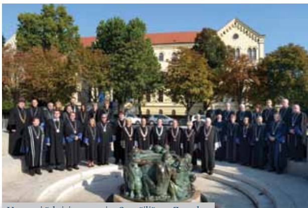
Uprava i čelnici sastavnica Sveučilišta u Zagrebu