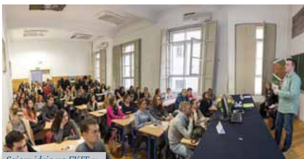
Sajam ideja na FKIT-u

Kako bi se intenzivirala i unaprijedila suradnja s gospodarstvom, što je jedan od strateških ciljeva Fakulteta kemijskog inženjerstva i tehnologije, osnovano je Gospodarsko vijeće Fakulteta kojeg čine aktivni zainteresirani nastavnici s Fakulteta i ugledni stručnjaci – prijatelji Fakulteta iz gospodarstva i javnih institucija. Vijeće će sudjelovati u definiranju kompetencija koje bi trebali imati budući zaposlenici i završeni studenti FKIT-a. Gospodarsko vijeće također će potpomagati i koordinirati akcije Fakulteta oko reguliranja profesije kemijskih inženjera u Hrvatskoj. Planira se i intenziviranje osnivanja spin-off tvrtki Fakulteta i podrške njihovom radu.