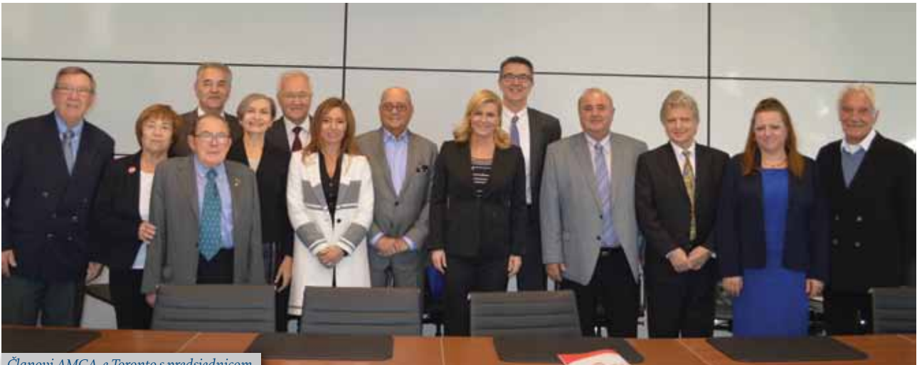
Članovi AMCA-e Toronto s predsjednicom

AMCA-e Toronto gđa Grabar-Kitarović je zahvalila na njihovom radu, čestitala na svim dosadašnjim uspjesima te pozvala da nastave podržavati i promovirati hrvatsku kulturu i Hrvatsku uopće.