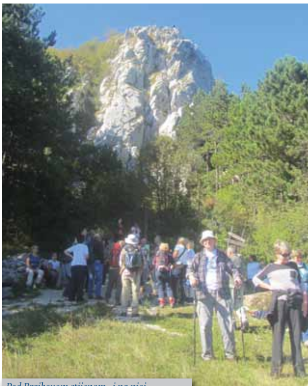
Pod Brajkovom stijenom...i na njoj

Planinarsko-izletnička sekcija opisuje svoje izlete u Bosansku Krupu, Korita (Istra), te starim cestama i mostovima do starih gradina i dvoraca (Novigrad, Bosiljevo, Modruš). Ovi su izvještaji popraćeni s odličnim fotografijama i opisima lijepih dijelova kojima izletnici prolaze.