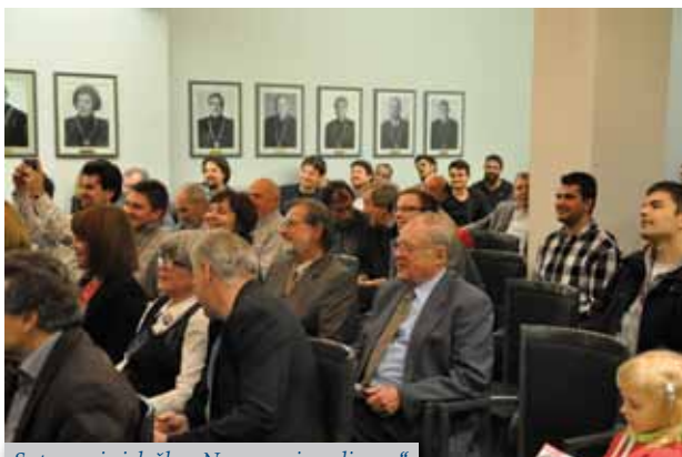
Sotvorenja izložbe „Na ramenima divova“

Fakultet strojarstva i brodogradnje Sveučilišta u Zagrebu već tradicionalno u mjesecu studenome obilježava svoje dane, pri čemu je ove godine obilježeno 97 godina od osnutka i 60 godina rada kao samostalnog fakulteta. Tim povodom organizirana su od 15. do 18. studenog 2016. različita događanja s ciljem predstavljanja Fakulteta, studentskih udruga i povezanosti s hrvatskim gospodarstvom. Tako je 15. studenog otvorena izložba pod naslovom „Na ramenima divova“ na kojoj je prikazana djelatnost petorice profesora koji su svojom djelatnošću najviše zaslužni za razvoj i ugled Fakulteta. Inicijatorica izložbe jeste dr. sc. Tea Žakula, docentica na FSB-u. To su (abecednim redom) prof. dr. sc. Davorin Bazjanac, prof. dr. sc. Fran Bošnjaković, prof. dr. Aleksandar Đurašević, prof. Leopold Sorta i prof. dr. sc. Stepan P. Timošenko. Izloženi su preslici naslovnica knjiga i znanstvenih radova koje su objavili te neki rukopisi i osobni predmeti. Na samom otvorenju o njihovom radu kratko su govorili profesori s FSB-a koji su s njima surađivali ili se bave sa srodnim područjem.