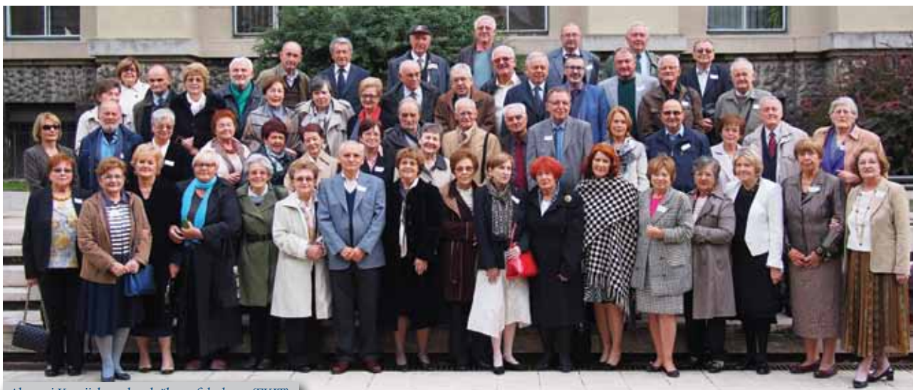
Alumni Kemijsko-tehnološkoga fakulteta (FKIT)