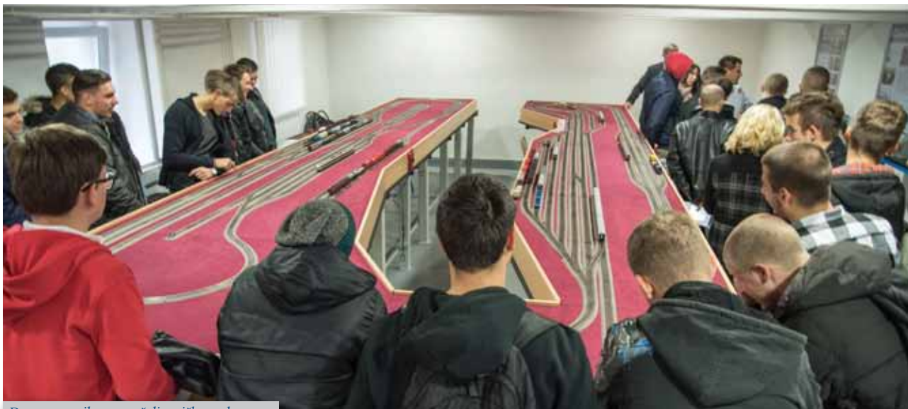
Dan otvorenih vrata - željeznička maketa

Znanstveno-istraživački i stručni rad je organiziran kroz zavode i zavodske laboratorije. Laboratoriji su opremljeni suvremenom mjernom, programskom i komunikacijskom opremom pretežno nabavljenom iz vlastitih sredstava Fakulteta. Katalog opreme i programskih paketa fakultetskih laboratorija se kontinuirano ažurira i javno je dostupan.