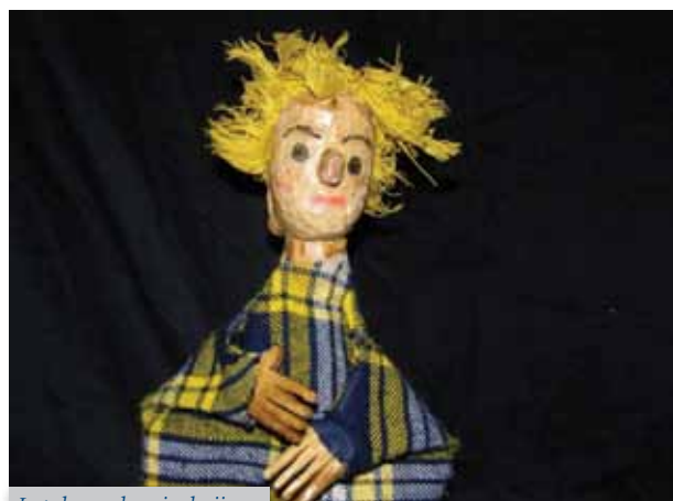
Lutak s naslovnice knjige

Knjiga mi je puno značila, jer sam magisterij napisao nakon prometnog udesa. Rad u drvu je na neki način za mene imao i terapijsko značenje. Već ranije sam prepoznao da djeca izuzetno dobro reaguju na lutke naravno ukoliko to isto čini terapeut. Naslov knjige mi je podarila jedna djevojčica koja je na pitanje što sve mora imati lutka odgovorila; „.. treba imati i srce i pamet...“ I zaista u terapiji s lutkama ne ide jedno bez drugoga. Kao dječji terapeut smatram da dijete treba odabrati oblik izražavanja i komunikacije, terapeut ga slijedi kao što igla na gramofonu ureze na ploči. Terapiji je imanentan proces rasta i razvoja.