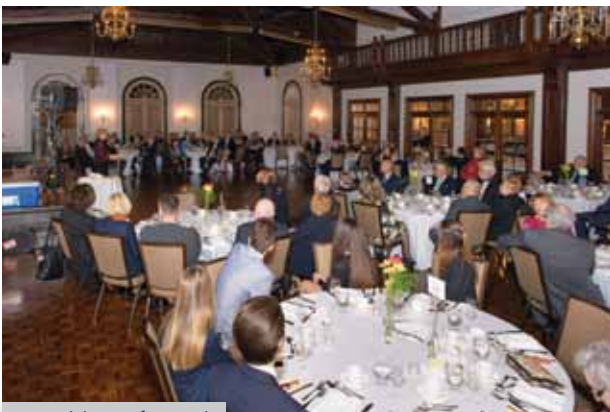
Uzvanici na Gala večeri

U listopadu ove godine, u prestižnom Boulevard Klubu u Torontu, članovi i prijatelji udruge AMCA Toronto proslavili su jubilarnu 15. godišnju dobrotvornu Gala večer.