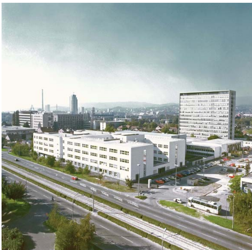
Zgrada Fakulteta elektrotehnike i računarstva Sveučilišta u Zagrebu, fotografija: Damir Fabijanić

(vi) š t i ć e n j e zajedničkih interesa Sveučilišta i alumnijske. Sve za dobrobit Sveučilišta i njegovih alumnijske i prijatelja! Oni koji prate razvoj i djelovanje Saveza AMAC – UZ, složiti će se da, polako, ali sigurno, Savez Alma Mater Alumni Sveučilišta u Zagrebu ispunjava svoju misiju. Najnovije mjere bit će već spominjana zajednička adresa alumnijske i zajednička akcija Saveza i Sveučilišta kao zakladnika - Zaklade Sveučilišta u Zagrebu. Obje su akcije integrirajuće i pobliže o njima molim pročitajte u prilogu današnjeg gosta urednika gospodina Srećka