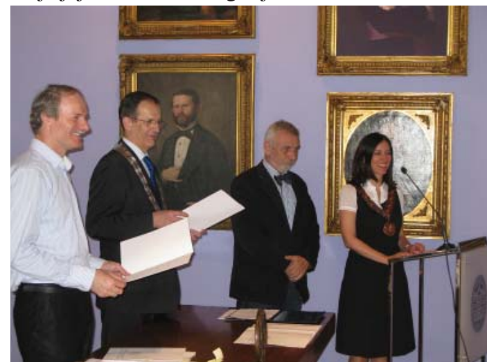
Dodjela stipendija Sveučilišta u Zagrebu

27. do 29. lipnja 2012. - na Sveučilištu u Zagrebu je održana godišnja međunarodna konferencija mreže European Access Network pod nazivom Access to Higher Education: is it a right, a privilege or a necessity? (Affordability, Quality, Equity & Diversity) . Ovogodišnja konferencija mreže European Access Network , na kojoj je sudjelovalo oko 130 sudionika iz dvadesetak zemalja Europe, Afrike, Sjeverne Amerike i Australije, bila je usmjerena na raspravu o pristupačnosti, kvaliteti, jednakosti i različitosti visokog obrazovanja, te o međudjelovanju i osiguravanju ovih načela u akademskom okruženju.