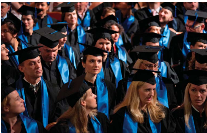
Novi doktori znanosti Sveučilišta u Zagrebu

stupnika, što je za 2012. godinu značajno više u odnosu na 760 promoviranih u 2011. te 496 promoviranih pristupnika u 2010. godini. Rektor prof. dr. sc. Aleksa Bjeliš se u svojim govorima posebno osvrnuo na trenutni položaj istraživačkog sustava u Republici Hrvatskoj te istaknuo kako bi on jednako kao i bilo koji drugi nacionalni sustav, izgubio smisao i budućnost ukoliko ne bi na optimalan način bio dio nacionalne investicijske strategije razvoja, temeljenog na kreativnosti i novim tehnologijama u najširem smislu riječi . Rektor Bjeliš se osvrnuo i na recesijske restrikcije koje traju već nekoliko godina, a zacrtane su u proračunskim smjernicama za sljedeće razdoblje, zbog čega je u opasnost doveden i istraživački sektor razvijan u proteklih nekoliko desetljeća.