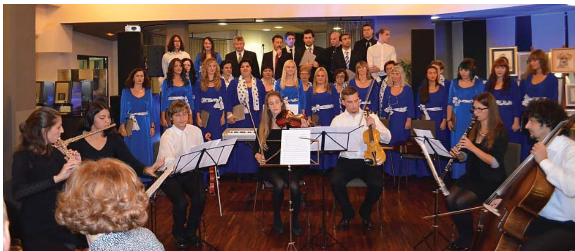
Nastup zbora „Ab ovo“ u pratnji orkestra na 5. Hrvatskom veterinarskom kongresu u Tuheljskim toplicama