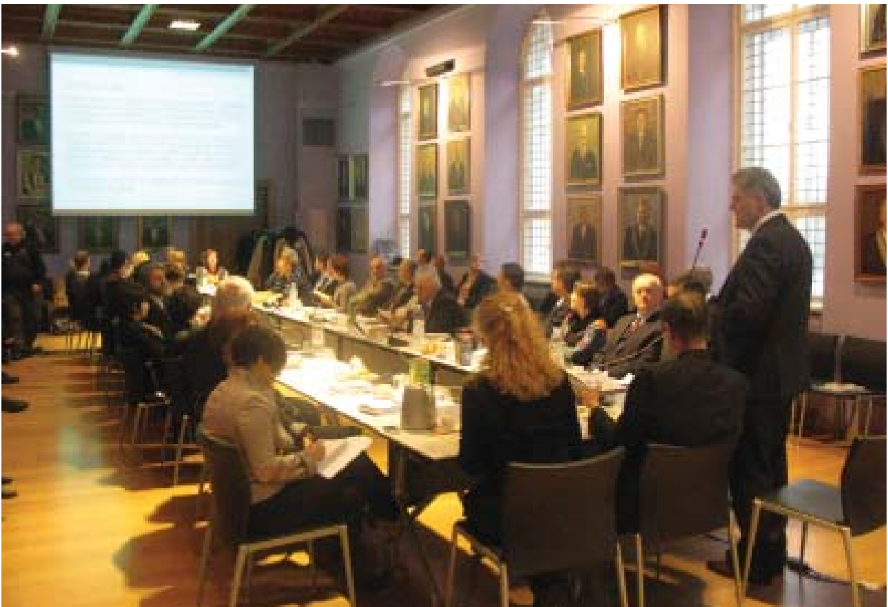
S uvodnog predavanja prof. Bežovana