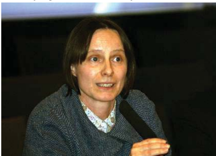
Prof. dr. sc. Ksenija Turković

3. listopada 2012. - donedavno prorektorica za međunarodnu suradnju i pravne poslove prof. dr. sc. Ksenija Turković izabrana je za sutkinju Europskog suda za ljudska prava u Strasbourgu. Dužnost sutkinje Europskog suda preuzet će početkom prosinca na mandat od devet godina, a na toj će dužnosti zamijeniti Ninu Vajić, prvu hrvatsku sutkinju u tome sudu.