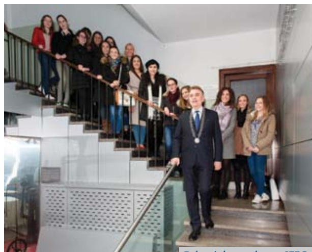
Dekan i zbor studenata SFZG

Te se večeri, dvadeset godina nakon apsolviranja, nisu reminiscirale ove teme. Četrdeset dvoje alumnija međusobno su si izgledali mlado kao onih godina, a dame su bile još ljepše nego onda. Zahvalan sam svim kolegama koji su se potrudili doći iz Zadra, Splita, Umaga, Graza i Bjelovara, uz ostale iz Zagreba i okolice. Svečani program je započeo u predavaonici Fakulteta, uz pjenušac i tortu. Prilikom ulaska nas je dočekalo iznenađenje - zbor studenata Stomatološkog fakulteta imao je svoju premijeru. Otpjevali su nam pjesmu „Milena, generaciju“ Novih fosila.