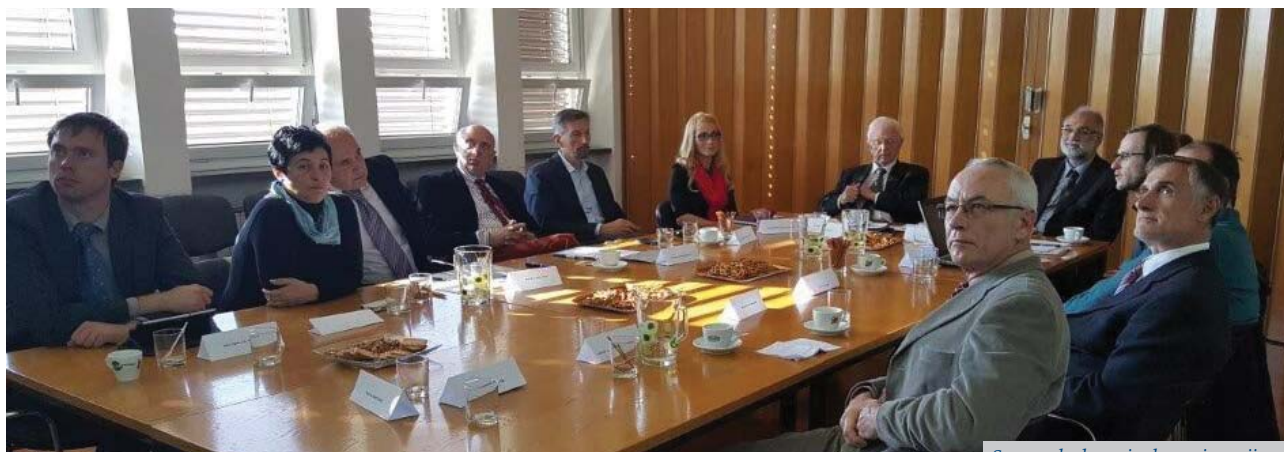
Sastanak alumni udruga iz regije

Na inicijativu ALUMNI društva Fakultete za strojništvo, Univerze u Mariboru 12. studenog 2015. godine na Fakulteti za strojništvo održan je prvi sastanak ALUMNI udruga iz regije. Sastanak je organiziran u cilju unaprjeđenja suradnje udruga i sudjelovanje u projektima od zajedničkog interesa. Sastanku su prisustvovali predstavnici ALUMNI udruga sa sljedećih fakulteta: Strojniški fakultet Univerze u Mariboru, Strojniški fakultet Univerze u Ljubljani, Fakultet strojarstva i računarstva Sveučilišta u Mostaru, Tehnički fakultet Sveučilišta u Rijeci i Fakultet strojarstva i brodogradnje Sveučilišta u Zagrebu.