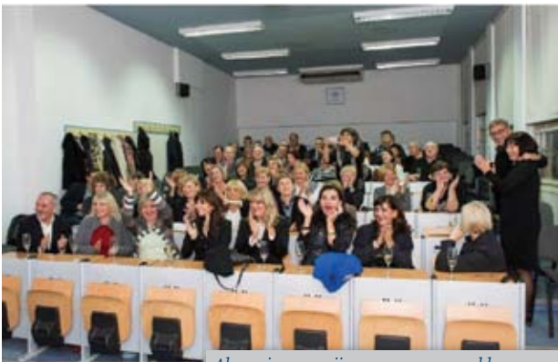
Alumni generacije 1975. ponovno u klupama

Prema tradiciji AMA SFZG, alumni udruge Stomatološkog fakulteta u Zagrebu i sastajanja bivših studenata, organiziran je sastanak generacije stomatologa upisanih na Stomatološki fakultet 1975. godine, a koja je absolvirala i/ili diplomirala 1980. i 1981. godine. Ova generacija sastala se 17.10.2015. u prostorijama Predavaonice Stomatološkog fakulteta, Gundulićeva 5. Dakle, bilo je to 40 go-