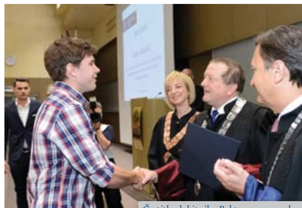
Čestitke dobitniku Rektorove nagrade