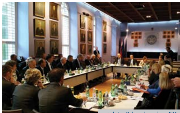
1. sjednica Rektorskog zbora RH