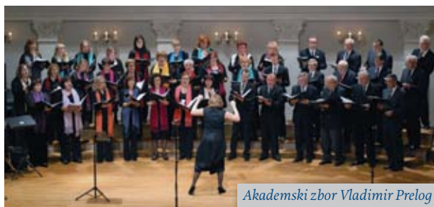
Akademski zbor Vladimir Prelog

Najstarija sekcija AMACIZ-a, Akademski zbor Vladimir Prelog, u jeku je priprema za svoju 25. godišnjicu u 2016. Program godišnjeg koncerta, održanog 8. ožujka 2015. u Hrvatskom glazbenom zavodu (HGZ), predstavljao je repertoarni iskorak u odnosu na dosadašnje i uključivao je zbarske obrade suvremenih popularnih pjesama uz solističke nastupe članova zbora, kojima je to bio prvi javni nastup. S takvim repertoarom Zbor je nastavio nastupati tokom godine: u Ozlju, na 5. Festi Choralis Zagrabien-sis u HGZ-u, te na Festivalu amaterskog kulturnog stvaralaštva u Vrsaru i svuda ga je izvrsno primila publika. Zbor je sudjelovao i na 38. susretima zagrebačkih glazbenih amatera u Zagrebu . Jubilarni godišnji koncert održat će se 20. ožujka 2016., a program će biti presjek najuspješnijih skladbi koje je zbor izveo u proteklih pet godina.