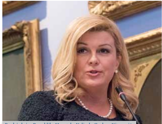
Predsjednica Republike Hrvatske Kolinda Grabar-Kitarović

izgradi Hrvatska kao zemlja obrazovanih, slobodnih, kreativnih i tolerantnih pojedinaca koji će u njoj vidjeti najbolje mjesto pod suncem za svoje ljudsko, profesionalno, znanstveno, akademsko i svako drugo ostvarenje.