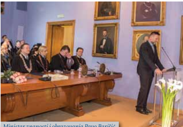
Ministar znanosti i obrazovanja Pavo Barišić

Strossmayera i bana Ivana Mažuranića. Upravo zahvaljujući zaslužnim hrvatskim prosvjetiteljima kao i svekolikom razvoju tadašnje Hrvatske stasalo je danas najveće sveučilište u Republici Hrvatskoj i svakako jedno od najuglednijih u ovom dijelu Europe. Metaforički je usporedio Sveučilište sa svjetionikom koji stoljećima svojim svjetlom znanja i otkrivanja istine obasjava prostore Hrvatske i jugoistočne Europe. Tome u prilog najbolje govori činjenica kako Sveučilište danas ima 34 sastavnice, 30 fakulteta, 3 akademije i 1 sveučilišni centar. Istaknuo je, kako je cijela mreža visokih učilišta u Lijepoj našoj respektabilna, ali ipak po svojoj prepoznatljivosti i ugledu zagrebačko sveučilište ostaje jedinstveno, ono je stožer i središte, kako znanstvenoga, tako i nastavnoga visokoškolskog djelovanja u Republici Hrvatskoj.