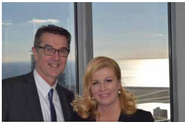
Krešimir Mustapić i Kolinda Grabar Kitarović

U uvodnoj riječi predsjednik AMCA-e Toronto Krešimir Mustapić podsjetio je na susret od prije točno deset godina, kad je AMCA Toronto ugostila ondašnju ministricu vanjskih poslova i europskih integracija, gospođu Grabar-Kitarović. "Nakon Vašeg izvanrednoga govora na Munk School of Global Affairs, te iz Vašeg nastupa, odmjerenosti i načina na koji ste odgovarali i na neka teška pitanja, dalo se naslutiti da će Vaša karijera nastaviti napredovati. Danas Vas ponovno ugošćujemo, ovog puta kao predsjednicu Republike Hrvatske" - rekao je u svojoj uvodnoj riječi g. Mustapić.