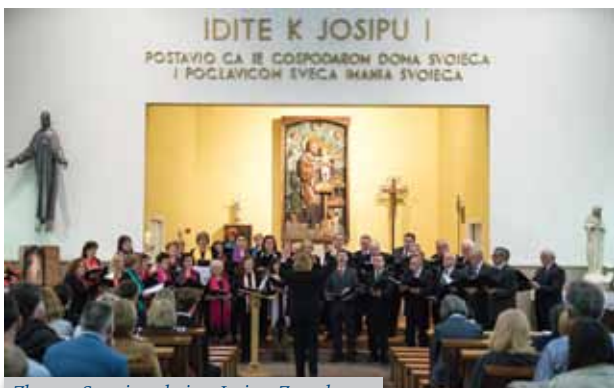
Zbor na Smoti u crkvi sv. Josipa, Zagreb

noj smotri, 39. susretima zagrebačkih glazbenih amatera, u crkvi sv. Josipa na Trešnjevci, te kasnije na koncertu održanom u okviru Festivala glazbe Zagreb 2016. u organizaciji Centra za kulturu Maksimir i Centra za glazbu Zagreb u maloj dvorani KD Vatroslava Lisinskog.