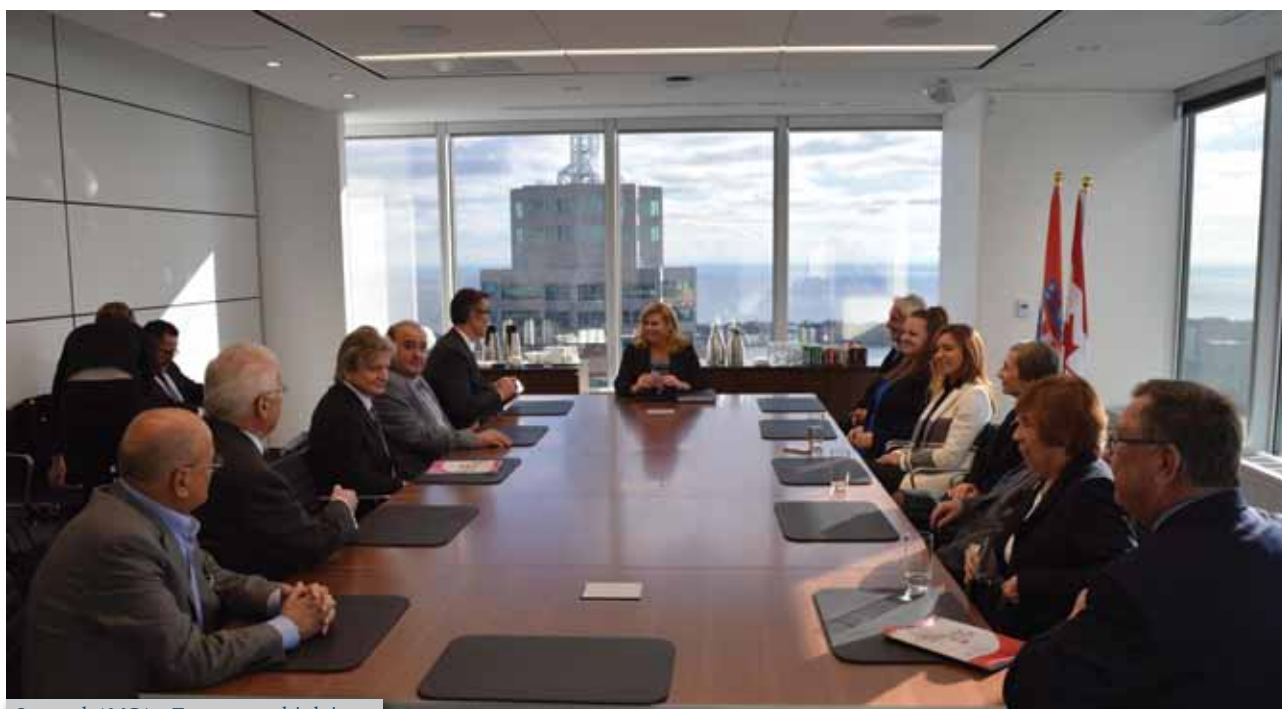
Sastanak AMCA-e Toronto s predsjednicom

U Torontu je ovih dana u radnom posjetu Kanadi bila predsjednica RH Kolinda Grabar-Kitarović. Uz vrlo uži protokol, gospođa predsjednica izdvojila je popodne 22. studenoga za susret s predstavnicima AMCA-e Toronto u prostorijama tvrtke Stikeman Elliot LLP u Commerce Courtu u Torontu.