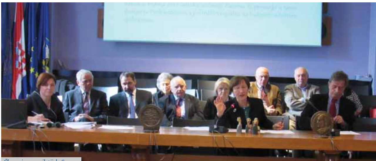
Članovi upravnih tijela Saveza

U auli Rektorata Sveučilišta u Zagrebu, 25. listopada 2016. održana je Skupština Saveza društava bivših studenata Sveučilišta u Zagrebu. Bila je to prigoda da se na jednom mjestu susretnu članovi alumni zajednice Sveučilišta u Zagrebu te razmjene iskustva u radu svojih udruga, ali se i bolje upoznaju kroz neformalno druženje nakon održane Skupštine.