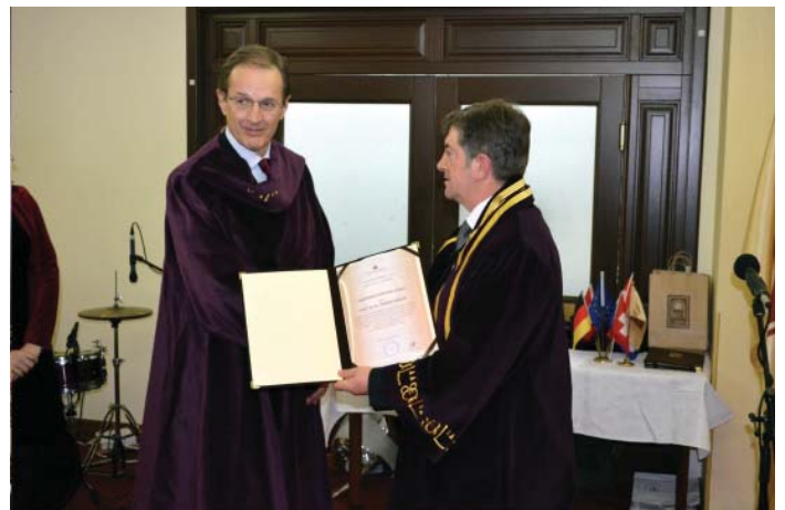
S dodjele počasnoga zvanja professor honoris causa Sveučilišta "St. Kliment Ohridski" u Bitoli