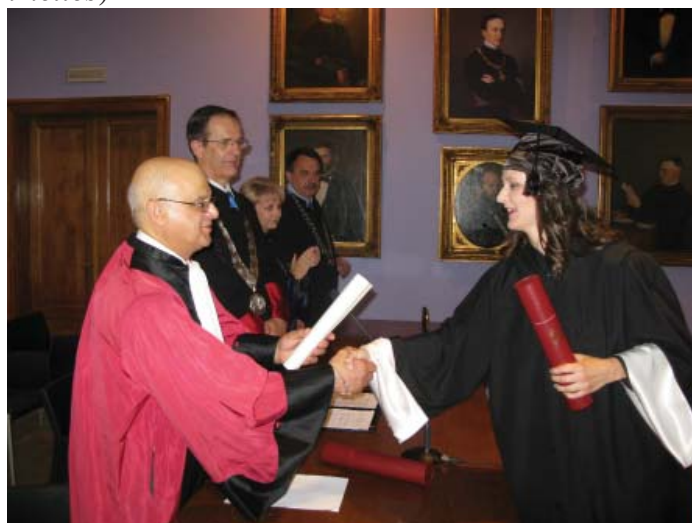
Podjela diplona magistra iz područja bioindustrije