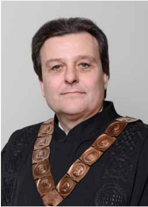
red. prof. art. MLADEN JANJANIN prorektor za umjetničko područje i međunarodni položaj Sveučilišta u Zagrebu

Rođen je 1962. u Vinkovcima. Diplomirao je klavir na Royal College of Music u Londonu sa samo 19 godina kao najmlađi diplomant u povijesti ove institucije. Završio je poslijediplomski studij klavira na Muzičkoj akademiji Sveučilišta u Zagrebu. Suradivao je s brojnim istaknutim svjetskim umjetnicima i pedagogima, a posebno je značajna njegova profesionalna suradnja s britanskim orguljašem i pijanistom Wayneom Marshallom s kojim već dugo godina uspješno nastupa. Bio je prodekan za međunarodnu suradnju i informatiku (od 2001.) te dekan Muzičke akademije Sveučilišta u Zagrebu u dva mandata. Začetnik je suradnje triju umjetničkih akademija Sveučilišta u Zagrebu, čime je osnažen utjecaj umjetničkog područja na razini Sveučilišta te obogaćen kulturni život Grada Zagreba. Obnašao je funkciju člana Kulturnog vijeća za glazbu pri Ministarstvu kulture Republike Hrvatske, bio je CMU koordinator pri CARNet-u, 2009. imenovan je članom Matičnog odbora za umjetnost pri Ministarstvu znanosti, obrazovanja i sporta, a odlukom Sabora Republike Hrvatske u listopadu 2011. imenovan je članom Nacionalnog vijeća za znanost. Dobitnik je brojnih nagrada i priznanja. Dao je poseban doprinos u realizaciji projekta izgradnje nove zgrade Muzičke akademije Sveučilišta u Zagrebu.