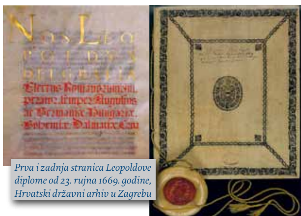
Prva i zadnja stranica Leopoldove diplome od 23. rujna 1669. godine, Hrvatski državni arhiv u Zagrebu

Sveučilište u Zagrebu obilježilo je 2014. godine dvije značajne obljetnice, 345 godina od utemeljenja uz Dan Sveučilišta 3. studenoga i 140 godina od osnutka modernoga sveučilišta 19. listopada. Valja naglasiti, prvi oblici visokoškolske nastave javljaju se 1607. godine u krilu isusovačke gimnazije. Teološki studij započeo je 1633. osnutkom posebne katedre za moralno bogoslovlje. Kolegijski kroničar bilježi 6. studenoga 1662. početak filozofskog tečaja, u ono vrijeme temelja svakog sveučilišnog studija pa se ta godina uzima kao početak visokoškolske nastave u Zagrebu. Više od 350 godina kontinuirane visokoškolske nastave na prvi se pogled ne čini se tako dugo jer znamo da povijest prvih europskih sveučilišta seže u jedanaesto i dvanaesto stoljeće. Uoči li se povijesni položaj Hrvatske, zadivljuju početni napori za utemeljenje našega najstarijeg sveučilišta s neprekinutim djelovanjem u ovom dijelu Europe.