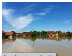
Potopljene kuće u Gunji

ne vode studenti su crtali i ispisivali lijepe i tople poruke kako bi barem na trenutak humanom blagošću dotaknuli stanovnike naselja Gunja, Rajevo selo... Studenti su brzo povezali organizacijske konce (od brojeva telefona do organizacije prijevoza) i u samo tjedan dana prikupljanja dostavili priloge obiteljima u potrebi.