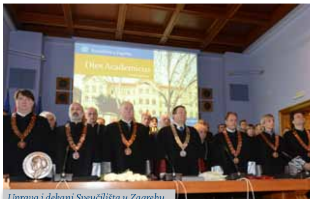
Uprava i dekani Sveučilišta u Zagrebu