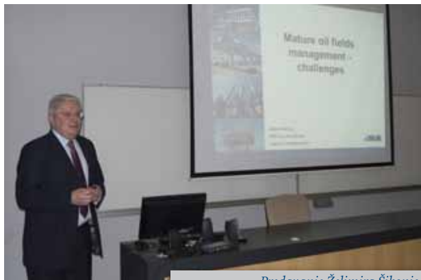
Predavanje Želimira Šikonje

Na inicijativu pok. biskupa mons. Marka Culeja, uz sponzorstvo Ine, obnova crkve započela je 1994. godine. Prvo je obnovljen oltar sv. Barbare, a obnova je u potpunosti završena 2010. godine. Posjet Belcu bila je izvanredna prilika za povezivanje Sveučilišta u Zagrebu, RGN fakulteta i studenata s tvrtkama u kojima rade bivši studenti, kao i prilika da pokažemo koliko se Fakultet zalaže za očuvanje tradicije i povijesti naših struka.