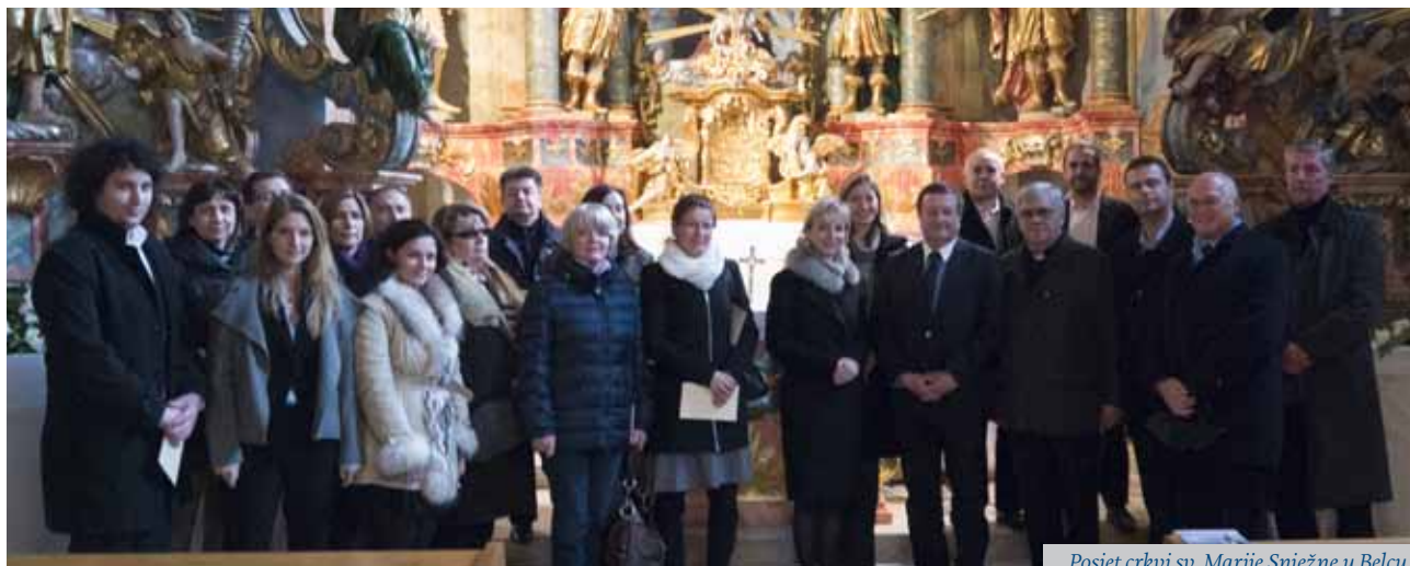
Posjet crkvi sv. Marije Snježne u Belcu

Organiziran je posjet predstavnika fakulteta, studentskih udruga, alumni udruge, kompanije INA te Sveučilišta u Zagrebu jednoj od najljepših baroknih crkvi u Hrvatskoj, crkvi sv. Marije Snježne u Belcu. Crkva je svoj današnji oblik dobila u XVI-II. stoljeću, kada je izrađeno pet raskošnih oltara, među njima i oltar sv. Barbare, zaštitnice rudara i opasnih zanimanja.