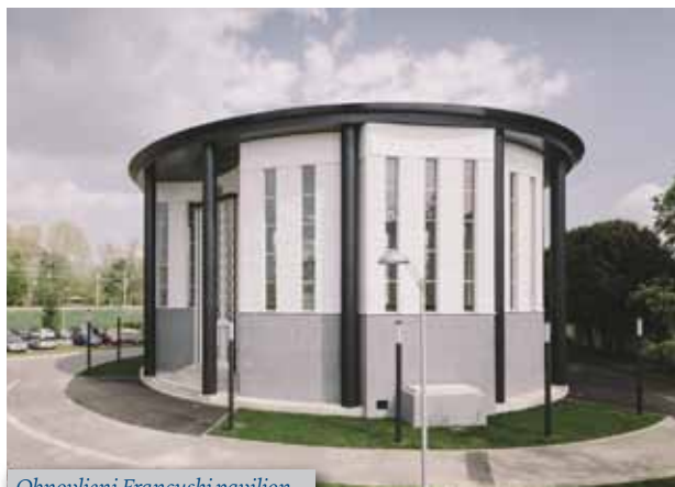
Obnovljeni Francuski paviljon

izložbeni paviljon Republike Francuske u sklopu sajamske priredbe Zagrebački zbor, koja se tada prvi put održala na novoj adresi u Savskoj ulici. Francuski arhitekt Robert Camelot i građevinski inženjer Bernard Lafaille imali na raspolaganju šest mjeseci za projektiranje i isto toliko za gradnju zahtjevnog jednodimenzionalnog paviljona kružnog tlocrta površine oko 600 m 2 . Ograničeni rokovima, odlučili su se na gotovo montažnu gradnju: vanjski nenosivi zid od armiranog betona i drveta te krov u obliku obrnutog stošca koji drži čelični prsten a nose čelični stupovi. Obnovljeni paviljon ubuduće će ugošćivati izložbene i kazališne projekte, a o programima će odlučivati povjerenstvo triju partnera koji su i sudjelovali u njegovoj obnovi: Grad Zagreb, Studentski centar i Sveučilište u Zagrebu.