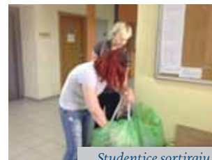
Studentice sortiraju prikupljene proizvode

Posebnu smo pažnju posvetili odabiru tema pod nazivom „Alumni dani“. Ova manifestacija dobila je svoje značajno mjesto prigodom obilježavanja rođendana Fakulteta. Naši mladi alumni/e, priznati stručnjaci u području Edukacijske rehabilitacije, Logopedije te Socijalne pedagogije u dva su dana prikazali najnovije stručne teme i probleme kojima se uspješno ili inovativno bave u zadnjih godinu dana. Odabrane radionice bile su namijenjene mentorima studenata i vanjskim suradnicima Fakulteta, naravno za sva tri studijska programa (tablica 1. Prikaz tema i predavača).