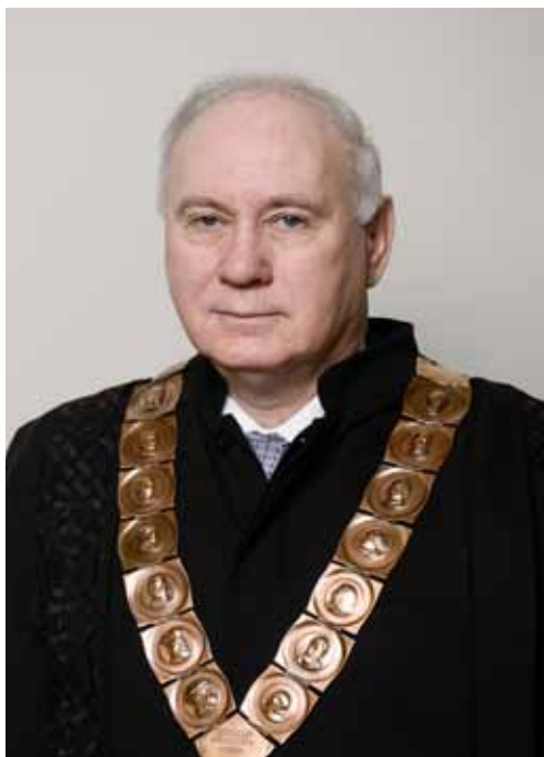
prof. dr. sc. ANTE ČOVIĆ prorektor za organizaciju, kadrovski razvoj i međusveučilišnu suradnju Sveučilišta u Zagrebu

Rođen je 1949. u Splitu. Na Filozofskom fakultetu Sveučilišta u Zagrebu diplomirao je 1975. filozofiju i latinski jezik. Godine 1976. završio je poslijediplomski tečaj Ethik und Gesellschaftstheorie na Interuniverzitetskom centru za postdiplomske studije u Dubrovniku, a doktorsku disertaciju obranio je 1989. na Filozofskom fakultetu Sveučilišta u Zagrebu. Od 1993. predstojnik je Katedre za etiku, a od 2010. pročelnik Odsjeka za filozofiju Filozofskog fakulteta Sveučilišta u Zagrebu. Od njegovog osnivanja 2006., voditelj je Referalnog centra za bioetiku u jugoistočnoj Europi. Obnašao je brojne dužnosti, između ostaloga, bio je ministar znanosti, tehnologije i informatike u Vladi demokratskog jedinstva Republike Hrvatske (1991.-1992.), potpredsjednik Bioetičkog povjerenstva Vlade Republike Hrvatske za praćenje genetski modificiranih organizama (2000.-2003.) te član Vijeća za GMO Vlade Republike Hrvatske (2008.-2013.). Član je Hrvatskog filozofskog društva u kojem je obnašao dužnost tajnika, a zatim i predsjednika. Jedan je od osnivača Kluba hrvatskih humboldtovaca te Hrvatskog bioetičkog društva. Dobitnik je Spomenice domovinskog rata (1993.), Povelje Hrvatskoga sabora za izniman doprinos u stvaranju samostalne i suverene Hrvatske (2010.), Nagrade Grada Zagreba za znanost (2014.) te drugih nagrada i priznanja. Bio je glavni i odgovorni urednik nekoliko domaćih i međunarodnih časopisa.