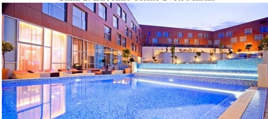
Slika 2. Lifeclass Terme Sveti Martin