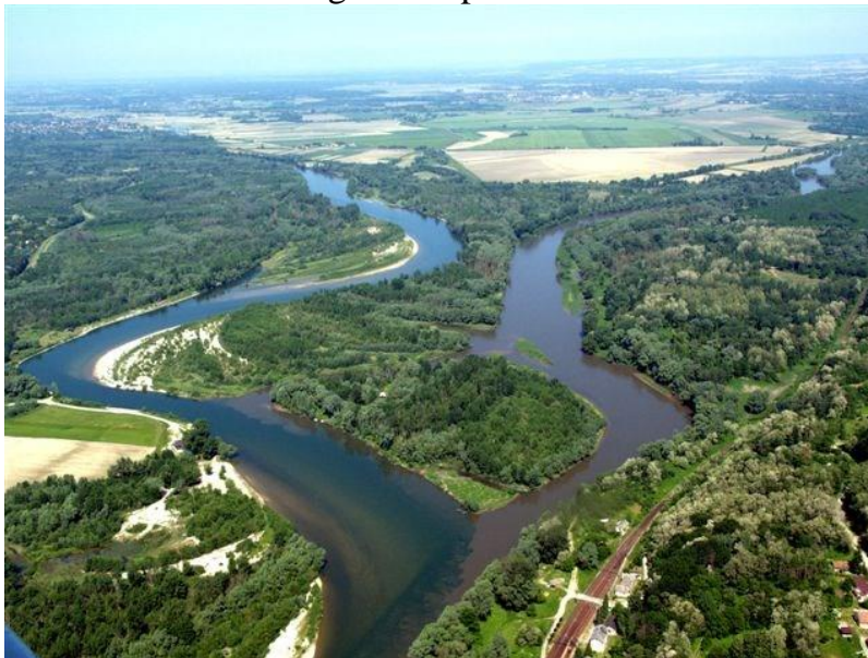
Slika 1. Regionalni park Mura Drava