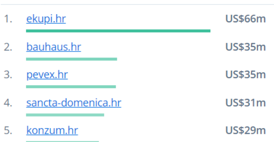
Slika 2. Poredak najpopularnijih e-trgovina u Hrvatskoj 2021.