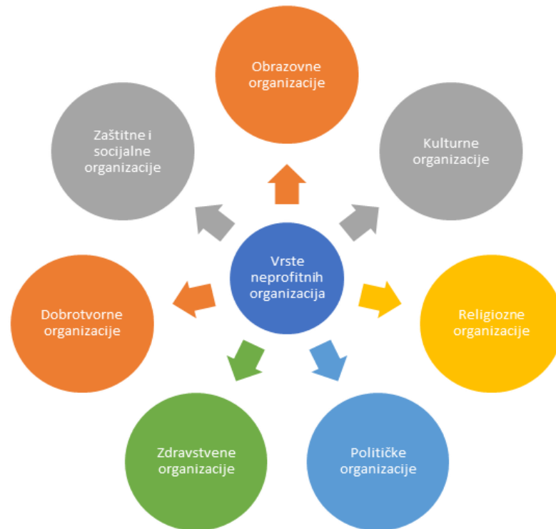
Slika 1. Ključna podjela neprofitnih organizacija